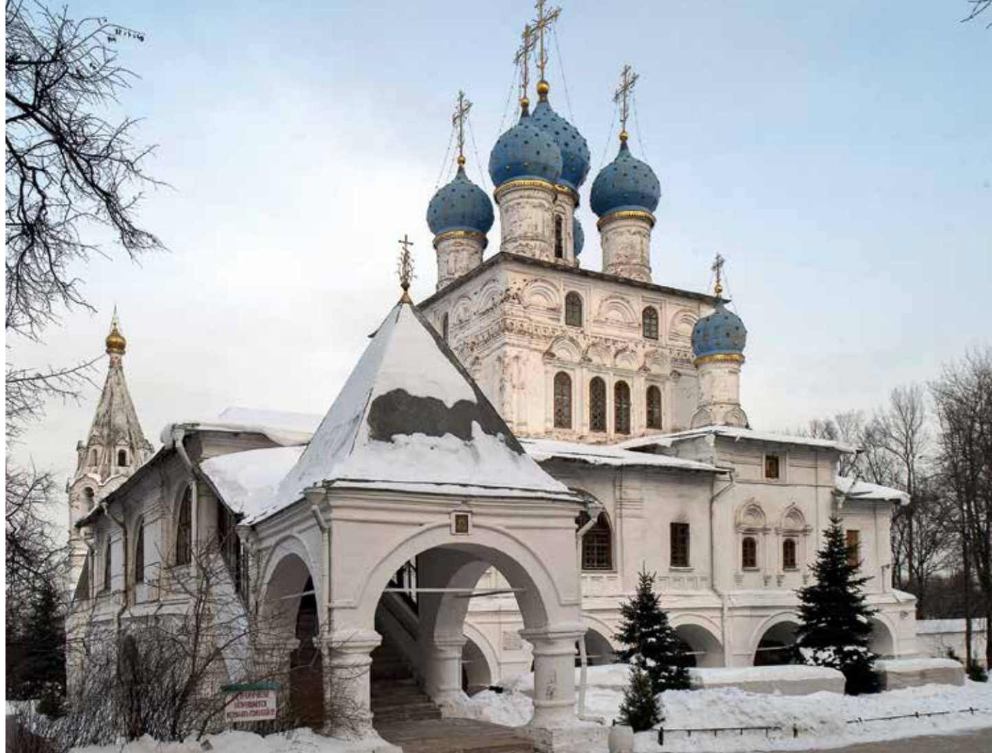
Храм Казанской иконы Божией Матери в Коломенском