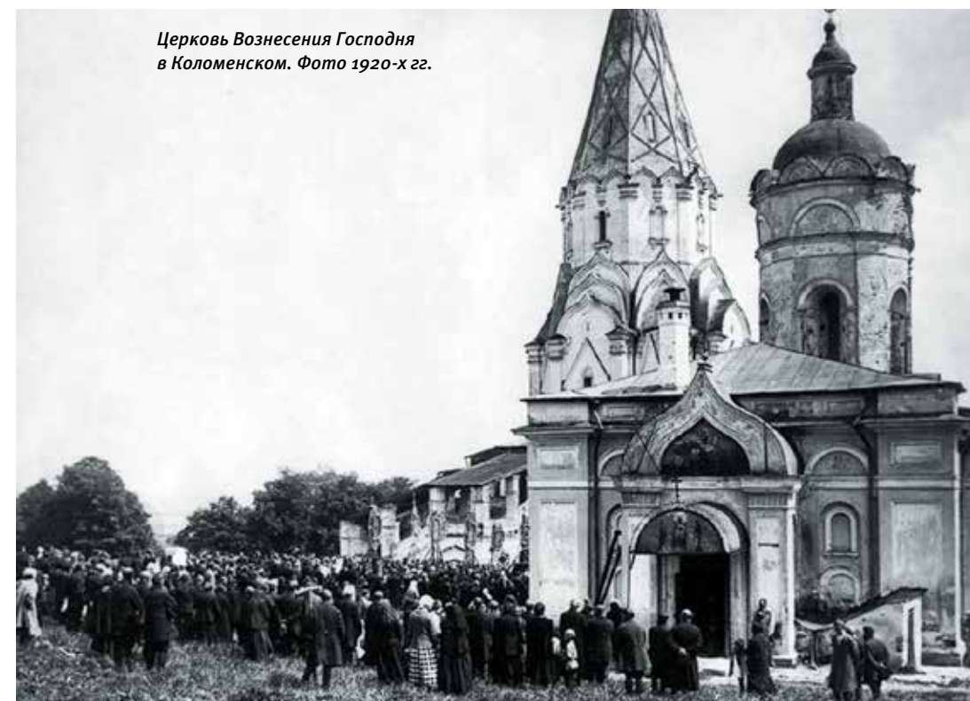
Церковь Вознесения Господня в Коломенском. Фото 1920-х гг.

В год празднования 1000-летия Крещения Руси, 15 апреля 1988 года, по просьбе заведующего Издательским отделом Московской Патриархии митрополита Волоколамского и Юрьевского Питирима и архимандрита Иннокентия (Просвирнина) образ был передан на выставку в Издательский отдел. Здесь святыня пребывала два года в алтаре домового храма во имя Преподобного Иосифа Волоцкого. Перед этим образом в 1988 году молился Патриарх Московский и всея Руси Пимен. Затем в соответствии с постановлением правительства о возвращении церковного имущества его законным владельцам по ходатайству Святейшего Патриарха Московского и всея Руси Алексия II икону было решено перенести в Коломенское. Что и было сделано 27 июля 1990 года, в канун памяти святого равноапостольного князя Владимира: икону перевезли в один из древних почитаемых московских храмов — Казанской иконы Божией Матери (XVI).