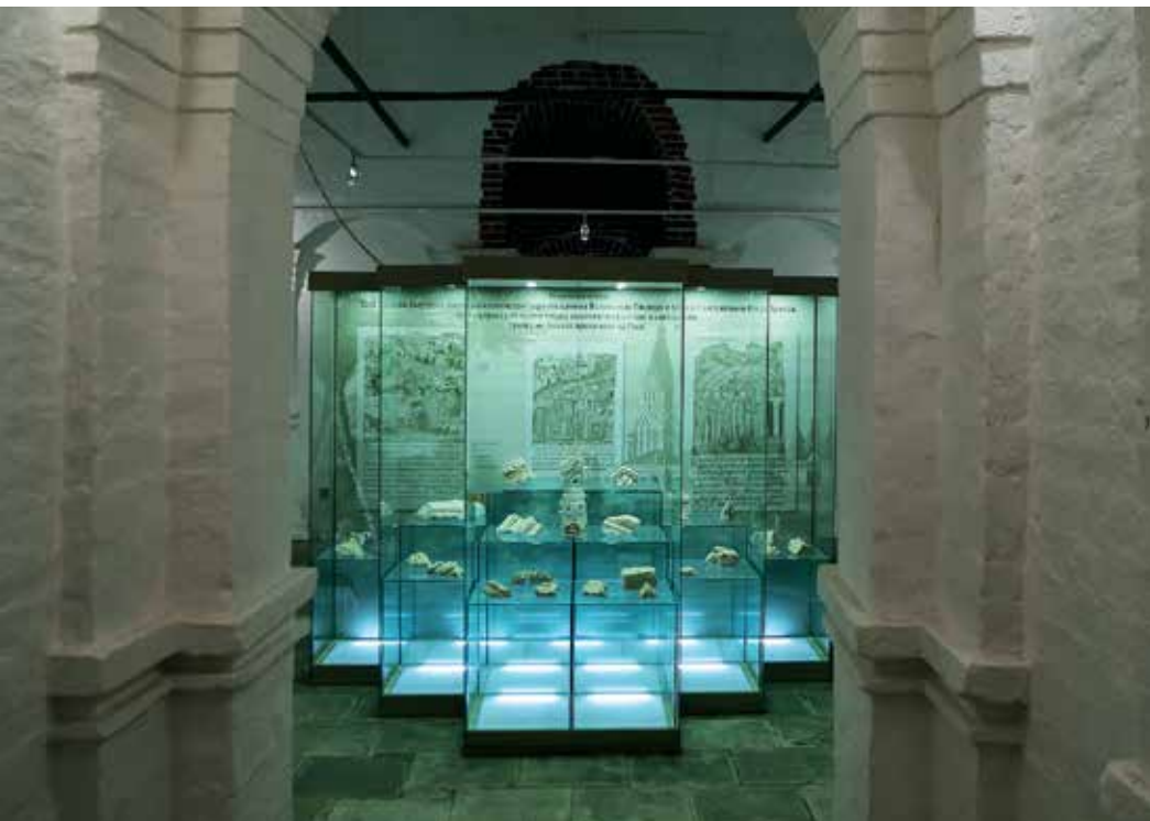
Экспозиция в подклете Вознесенского храма в Коломенском

1 От Пасхи до Покрова (14 октября) по воскресеньям два раза в месяц в храме Вознесения Господня служит клир храма Усекновения главы Иоанна Предтечи в Дьякове.