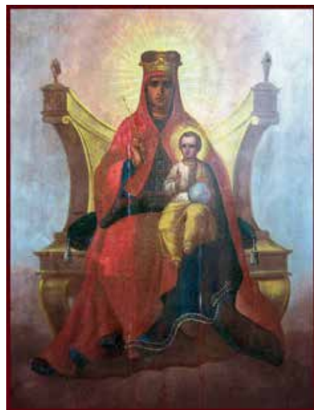
Почитаемые списки иконы Божией Матери «Державная»

8 февраля 1918 года в храме Богоявления Господня в Елохове, куда накануне из села Коломенского была принесена с крестным ходом новая икона Божией Матери, Святейший Патриарх Тихон совершил Литургию в сослужении архиепископа Коломенского Иосифа (Каллисто-