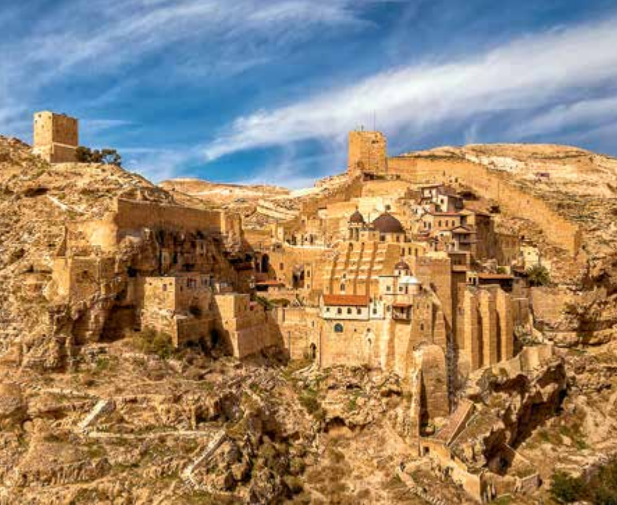
Великая Лавра Саввы Освященного (Дир Мар-Сабба) располагается в Вади Кедрон, в Иудейской пустыне, в 14 км от Иерусалима

хлеб, а к вечеру мясо (см. 3 Цар. 17, 6). Творцу всяческих легко найти многообразные способы для сохранения жизни Своих рабов. Так, Он трое суток хранил Иону во чреве кита (см. Иона 2); Он устроил так, что львы устрашились Даниила во рву (см. Дан. 6, 22); Он заставил бездушный огонь действовать разумно: находящихся внутри пещеры освещать, а бывших вне ее — опалить (ср. Дан. 3). Впрочем, нет особой необходимости приводить доказательства силы Божией, ибо она всем известна» 16 .