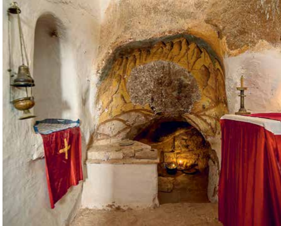
Пещера Или Пророка на Синае

Пещерные монастыри издавна существовали и на Руси 20 . Древнейший и знаменитейший из них — Киево-Печерский, в честь Успения Пресвятой Богородицы (возник ок. 1051 г.), с подземными храмами, разветвленной сетью Ближних и Дальних пещер, где располагались кельи и гробницы насельников обители, был устроен на берегу Днепра. Основатель обители преподобный Антоний († 1073), будучи постриженником одного из монастырей Афона, принес оттуда на Русь аскетические