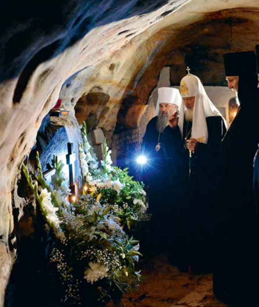
Первосвятительский визит в Псковскую епархию. Посещение пещер Псково-Печерского монастыря. 18 августа 2010 г.

в селе Пощупово под Рязанью, начинавший свою историю с пещерных келий (не позднее 1237), Нижегородский Печерский в честь Вознесения Господня мужской монастырь (1328 или 1330), Псково-Печерский в честь Успения Пресвятой Богородицы мужской монастырь (1473). Подобные пещерные обитатели устраивались и позднее — уже во времена Российской империи: Саровская в честь Успения Пресвятой Богородицы мужская пустынь (начало XVIII в.), Гефсиманский в честь Черниговской иконы Божией Матери мужской скит Троице-Сергиевой лавры (1844), в пещерном отделении которого к 1914 году проживало 77 насельников.