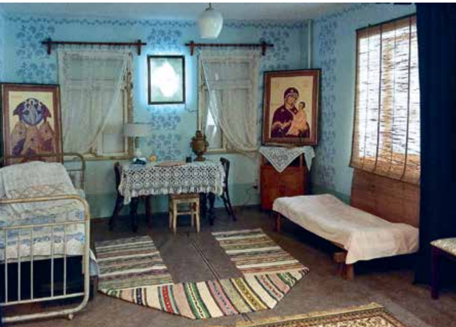
Мемориальная комната С. И. Фуделя в Покрове

поющими все про одно: «Возлюби Господа Бога твоего всем сердцем твоим, и всею душою твоею, и всем разумением твоим, и всею крепостью твоею!» «...И Ему одному служи!» 31