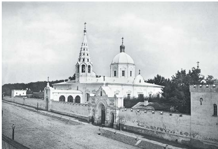
Крестовоздвиженский храм в 1834–1935 гг.

Храм Всех святых на восточной стороне, при котором было создано наше сестричество, а теперь восстановлен монастырь, был построен последним из чреды монастырских храмов в 1897 году и функционировал как кладбищенский для совершения