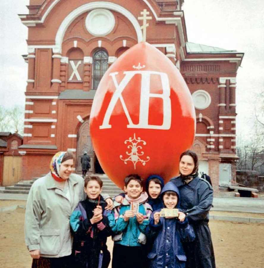
Прихожанки храма Всех святых с детьми из интерната на Пасху.