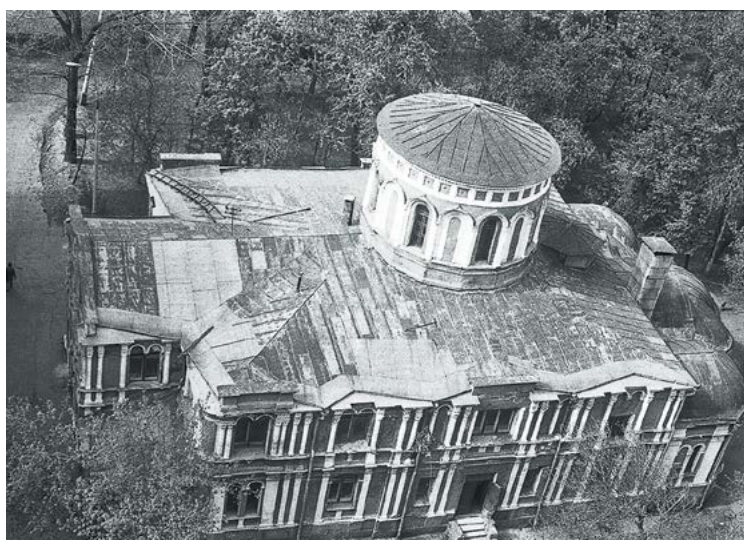
Храм преподобного Алексия, человека Божия, в Красном Селе. 1982–1983 гг.