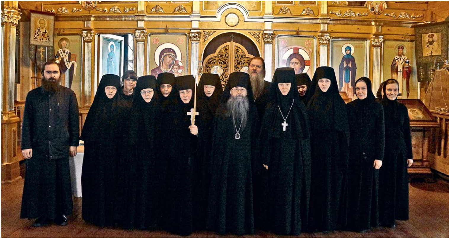
Монашеский постриг в Алексеевском монастыре

это делали и другие молодые прихожанки, которые участвовали в возрождении святого места.