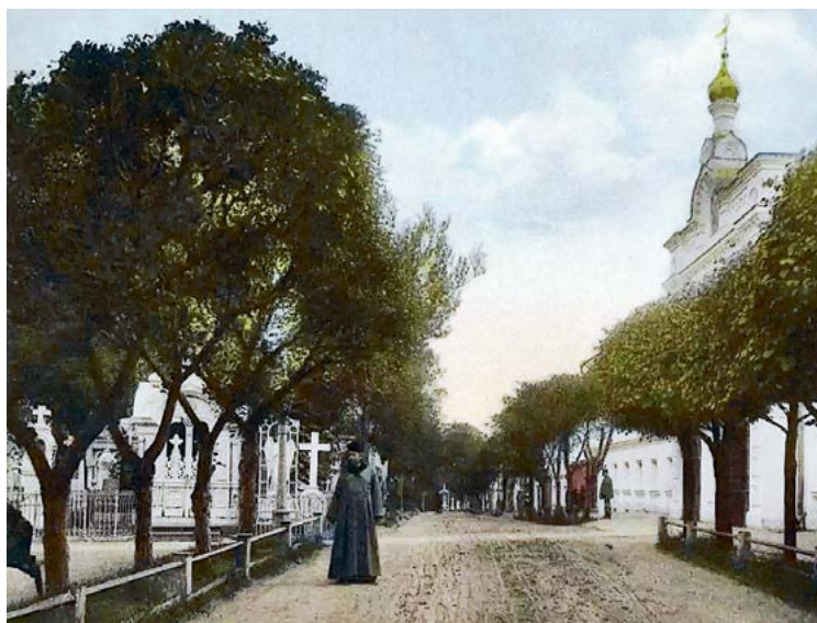
Аллея на территории Алексеевского монастыря. Конец XIX — начало XX в.