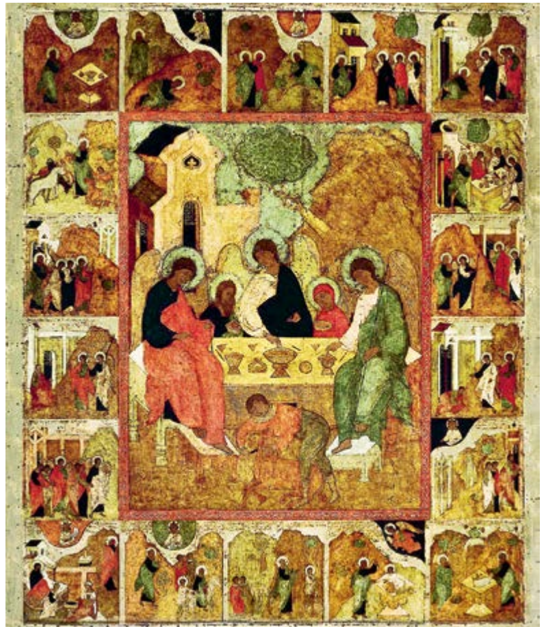
Андрей Рублев. Икона «Святая Троица» Первая треть XV в. (слева) Икона «Троица Ветхозаветная». XVI в. (справа)

Это событие можно рассматривать с разных точек зрения. Во-первых, оно свидетельствует о том, что икона преподобного Андрея Рублева приобрела к середине XVI столетия общецерковную известность. Во-вторых, о ней имела представление государственная власть, поскольку на работу Андрея Рублева ссылается собор в ответе на царский вопрос, как писать Святую Троицу. Но главное, эта икона была соборным разумом единодушно признана вершиной выражения центрального догмата христианской веры.