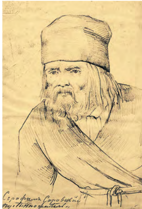
Открытие святых мощей преподобного Серафима Саровского, чудотворца. Москва, 1904. (слева)

Лет в шесть у меня уже сформировалось представление о святом Серафиме. В то время (середина 1960-х годов) история Саровской пустыни, города Сарова и биография Серафима Саровского находились под запретом, даже эти названия и имя святого нельзя было упоминать на территории секретного объекта, тем более за его пределами. А все тайное и запретное, как известно, особенно привлекает, поэтому, уже будучи старшеклассником, ходил по род-