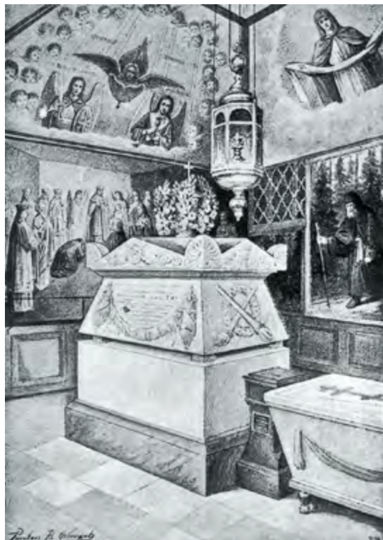
Надгробие в часовне над могилой преподобного Серафима Саровского. Литография. 1903 г.

кусок полотна и шерстяные чулки и, наконец, многократное коленопреклоненное прощание его со мною, которого я многими убеждениями не мог прекратить в нем и от которого я должен был поспешно с вами уехать, дабы не трудить более старца, продолжавшего стоять на коленях и кланяться, были, как после оказалось, выра-