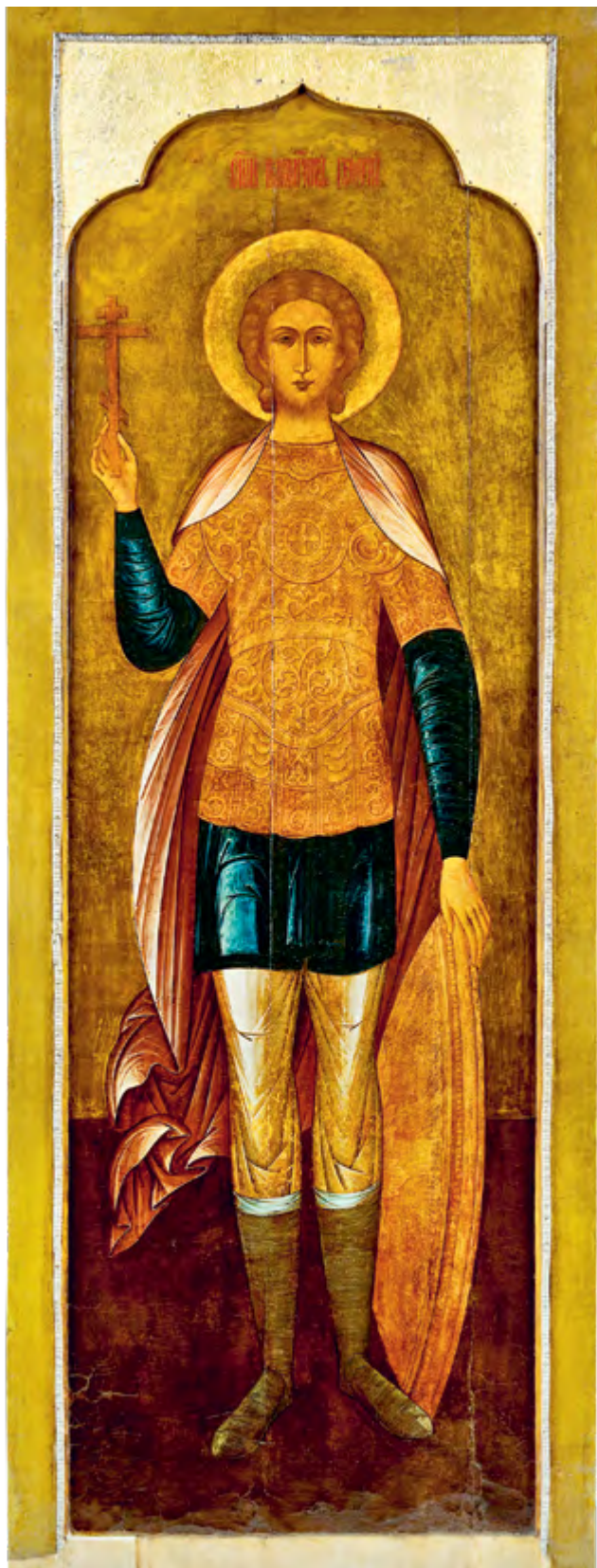
Святой великомученик Георгий Победоносец. Конец XIX в. Из собрания МГОМЗ (слева)