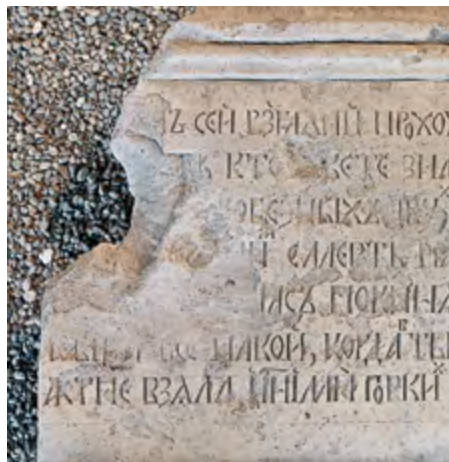
Надгробный крест. XVI–XVII вв. Из некрополя церкви Сергия Радонежского в Рогожской слободе (вверху)