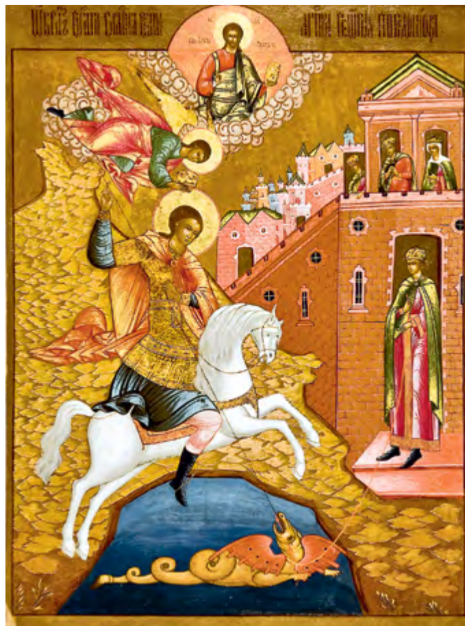
Чудо Георгия о змие. XIX в. Из собрания МГОМЗ (справа)