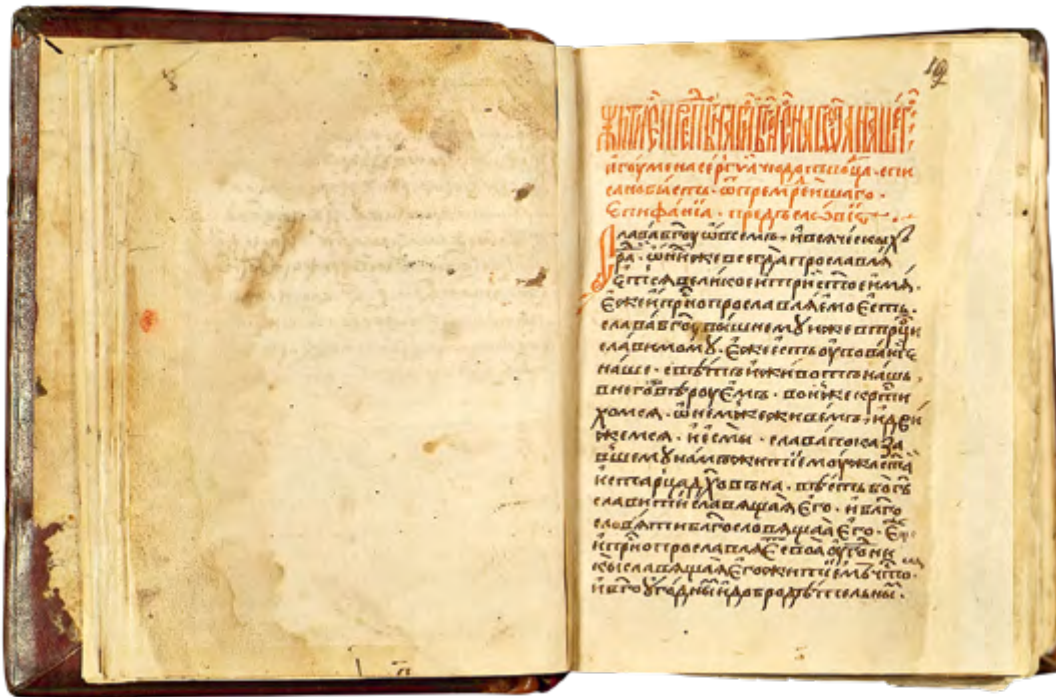
Начало Пространной редакции Жития Сергия Радонежского. Середина XVI в. Сборник житий. РГБ. Ф. 178/1. № 208. Л. 10

и величие его личности, монах-книжник стал собирать материал для Жития: