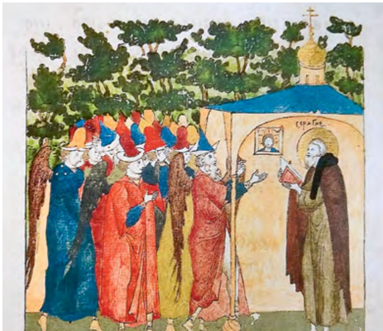
Нападение на Сергия бесов «в шапках литовских островерхих». Миниатюра лицевого Жития Сергия Радонежского. Конец XVI в. РГБ. Ф. 304/III. № 21. Л. 75 об.

одно из испытаний преподобного Сергия во время его отшельничества: