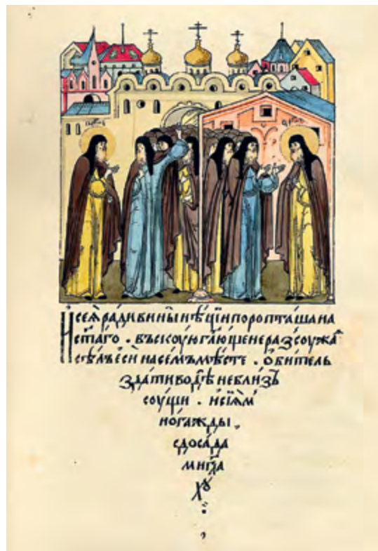
Икона «Преподобный Сергий Радонежский с житием». Вторая половина XVII в. Происходит из собора ростовского Троице-Сергиева Варницкого монастыря. Государственный музей-заповедник «Ростовский Кремль» (слева)

Немногочисленные сведения о жизни и деятельности инока Епифания, почерпнутые в основном из его сочинений, рисуют портрет разносторонне одаренной творческой личности 1 . Юные годы он провел в одном из крупных книжных центров второй половины XIV в. — ростовском монастыре Григория Богослова, так называемом Затворе, где, вероятно, принял постриг. Там Епифаний познакомился с произведениями славянской и греческой литературы,