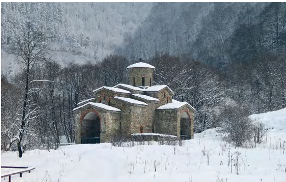
Северный Зеленчукский храм. XI в.

ской жизни и таинствах, для них храм — как клуб по интересам, они приходят в основном во внебогослужбное время. Есть такое понятие — хайкан (посещение храма с целью экскурсии), и эти люди в подобных случаях выступают волонтерами: стоят на входе, продают свечи и буклеты, следят за порядком в храме. Отсутствие интереса к вере они обычно объясняют так: меня окрестили во младенчестве, поэтому я ничего не знаю. И это говорит человек, которому 70 или 80 лет! Но есть и другие, кто очень глубоко верит; их немного, но, на мой взгляд, это тот добрый корень, от которого может пойти свежий росток. Они и обращались ко мне с духовными вопросами. Например: «Ты монах, научи нас молиться», «Что такое Иисусова молитва?» Они всерьез интересуются толкованием Священного Писания. Все четырнадцать лет я вел для них дэндокай — собрание оглашаемых. Несколько десятков человек приняли Святое Крещение после посещения этих занятий. На них мы по стихам читали и разбирали Священное Писание. В частности, прочли все послания апостола Павла. На каждом занятии у меня собиралось порядка 20–30 человек. Это много для дэндокай , носившего довольно академический характер. В глазах моих прихожан я видел подлинный интерес к Православию.