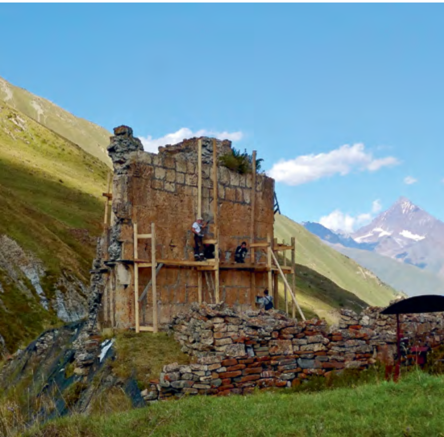
Работы по восстановлению зругского храма XI в. в честь Успения Пресвятой Богородицы (слева)