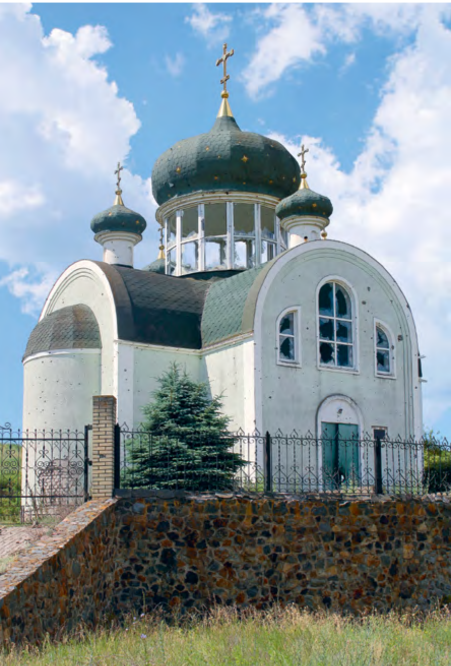
Сергиевский храм в деревне Широкино (слева)