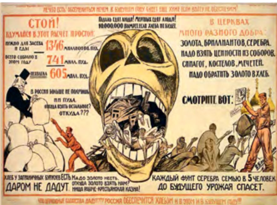
Агитационный плакат. Художник Михаил Черемных, автор текста Владимир Маяковский

Естественно, что прихожане сельских, да и большинства городских церквей знали, что никаких «золотых сокровищ» в них просто нет, но как они могли донести правду до организаторов изъятия в условиях разгромленной еще в 1918 году церковной печати? Между тем Предстоятелю Русской Церкви представился случай публично разъяснить положение дел. В середине марта в газетах начался двухнедельник проверки помощи голодающим, в рамках которого «Известия ВЦИК» разместили на своих страницах проведенные корреспондентами беседы с Патриархом Тихоном, главным раввином Москвы Я. И. Мазе, зампредом Центрального духовного управления мусульман К. К. Тарджи-