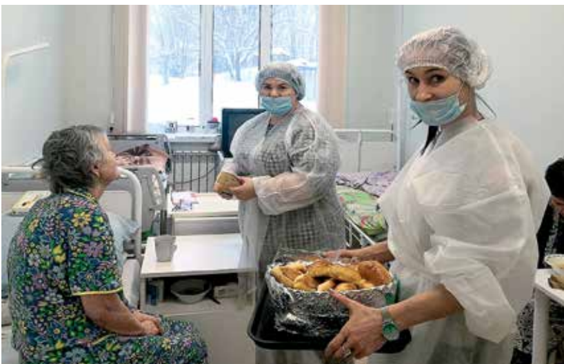
Добровольцы «Служения», Преображенский храм в с. Спас- Седчено (вверху)