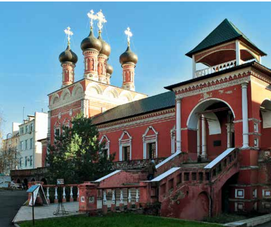
Храм преподобного Сергия Радонежского в Высоко- Петровском монастыре