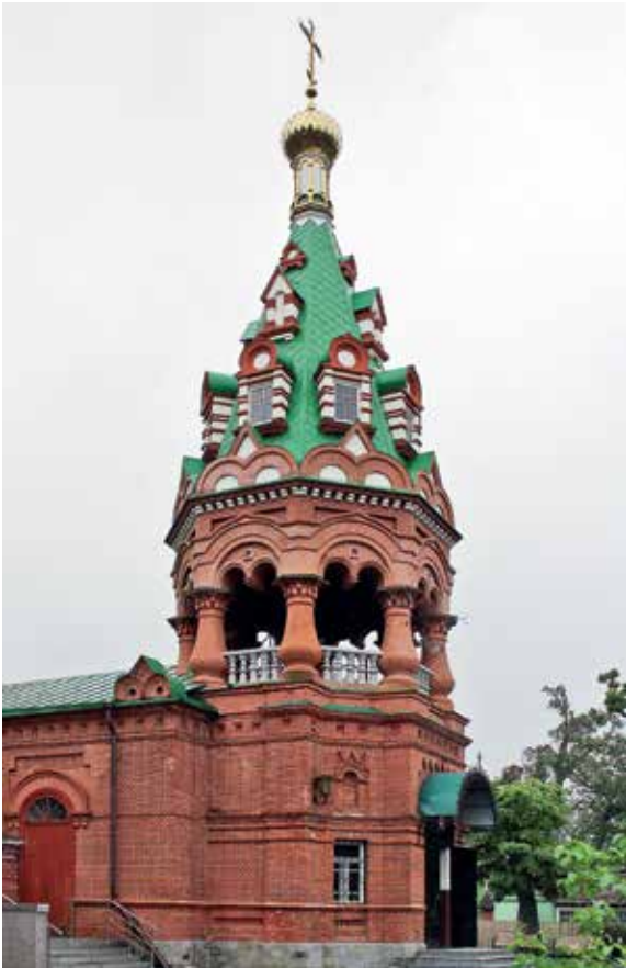
В Марфо-Мариинском женском монастыре на Седанке