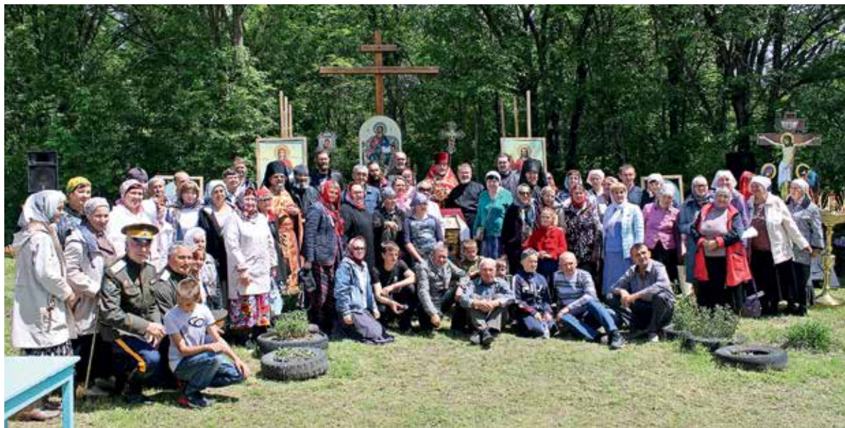
После Божественной литургии под открытым небом

О каком же зримом церковно-мемориальном воплощении может идти речь? Строитель-