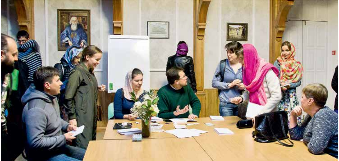
Катехизические занятия в храме Вознесения Господня, г. Екатеринбург

отказывается “заговаривать грыжу” ее малышу, пока ребенок не будет крещен. Сейчас такого уже нет: все же у всех есть интернет, а православные телеканалы и радио постепенно просвещают народ». Правда, и такую мотивацию, как «я хочу получить прощение грехов», по мнению наших респондентов, тоже нечасто услышишь. Поэтому неудивительно, что двух огласительных бесед об основных понятиях христианской нравственности и православного вероучения нецерковным людям явно недостаточно. Интересно, что никто не смог сказать, сколько точно человек после них стали постоянными прихожанами храма.