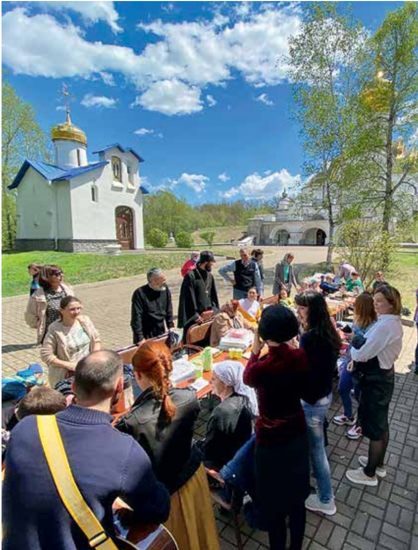
Занятия по катехизации в Хабаровской епархии, организованные храмом прп. Серафима Саровского