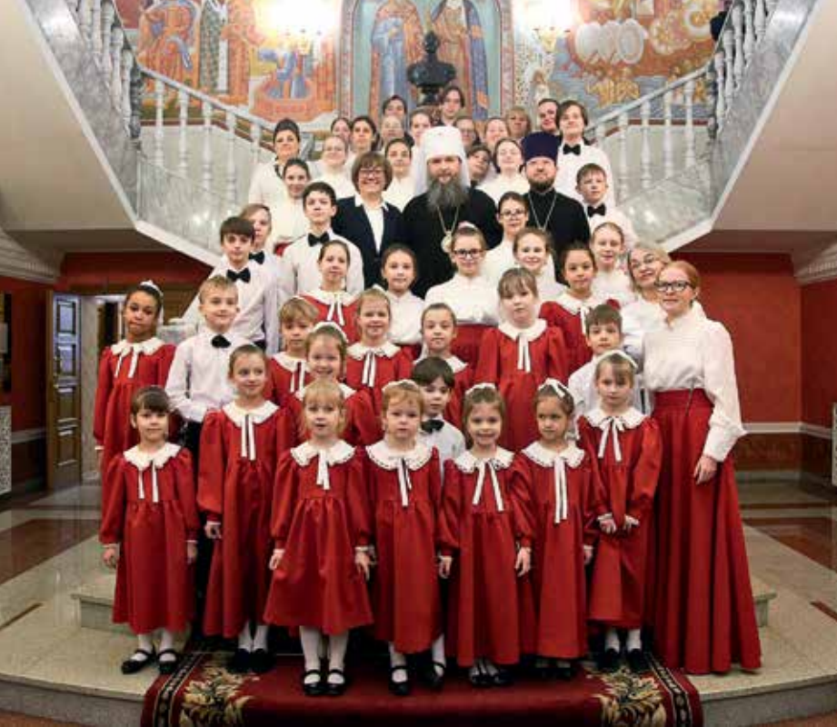
Митрополит Екатеринбургский и Верхотурский Евгений с детьми архидиоцессальной детской капеллы «Октоих». 13 декабря 2020 г.

святой Екатерине. В школах проводятся уроки екатеринбурговедения, в музеях — тематические выставки. Тем, кто проявил себя в делах милосердия, вручается памятный знак «Орден святой Екатерины». Деятели культуры, внесшие особый вклад в сохранение духовно-нравственных ценностей общества, награждаются Премией главы митрополии в сфере культуры и искусства.