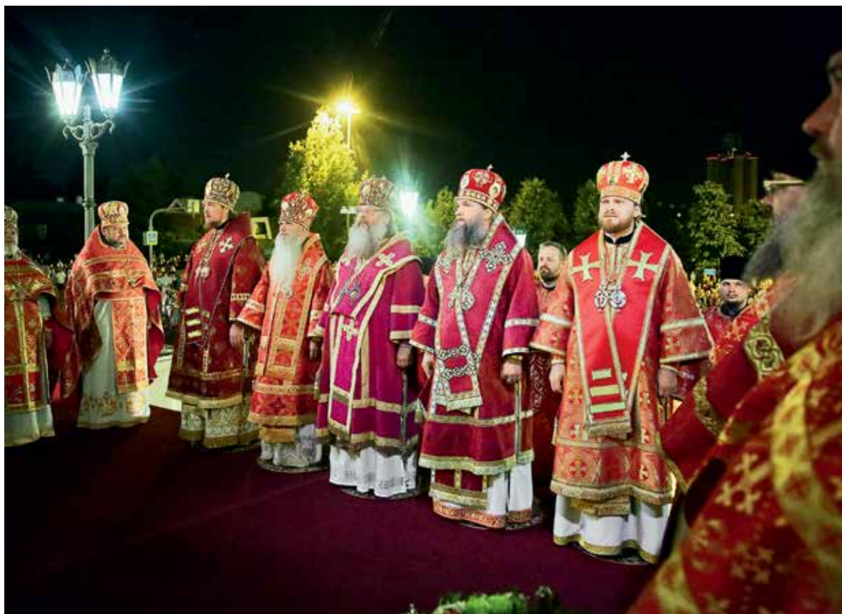
Богослужение в храме на Крови. В ночь на 16–17 июля 2020 г. (слева)