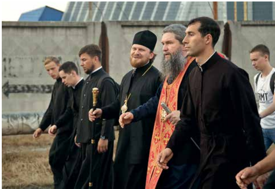
Митрополит Екатеринбургский и Верхотурский Евгений на Царском крестном ходе 16–17 июля 2020 г.

7 декабря — Свято-Екатерининский, в день святой великомученицы Екатерины, небесной покровительницы Екатеринбурга (от Свято-Троицкого кафедрального собора до часовни Святой Екатерины на историческом месте Градо-Екатерининского собора).