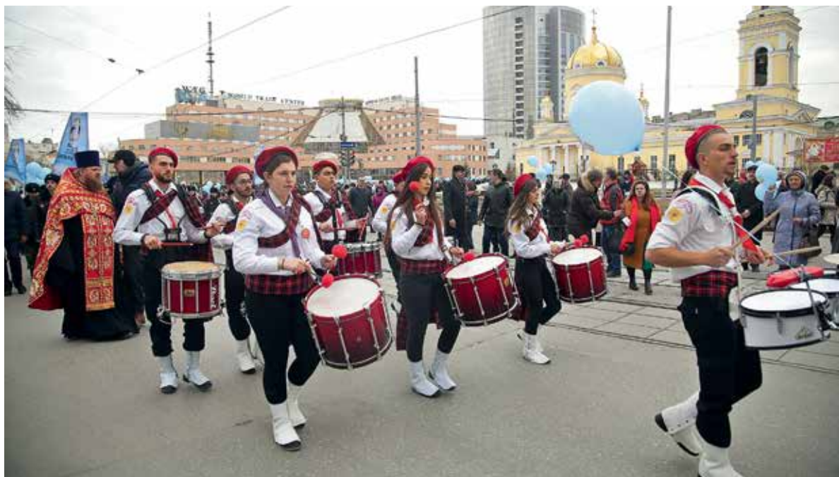
Оркестр палестинских скаутов на Пасхальном крестном ходе. Ул. Куйбышева, рядом с Троицким кафедральным собором. 2018 г.

— Сегодня у многих работников в системе образования сложилось понимание, что невозможно выстраивать живую, интересную и качественную работу с детьми только в условиях воскресной школы. Дети должны быть частью всей жизни в Церкви — участвовать в общих богослужениях и совместной молитве, активно общаться с духовенством, другими взрослыми