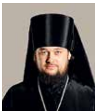
Диодор , епископ Мелекесский и Чердаклинский

Приступая к этой программе в нашем регионе, мы руководствовались напоминанием Святейшего Патриарха Кирилла о том, что наши предки, осваивая какое-то новое место, прежде всего ставили там храм. Поэтому церкви