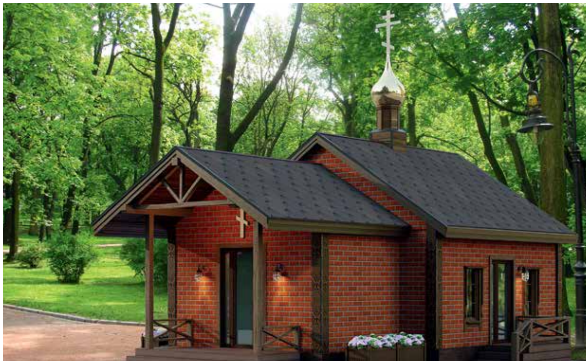
Вариант кирпичной отделки фасада