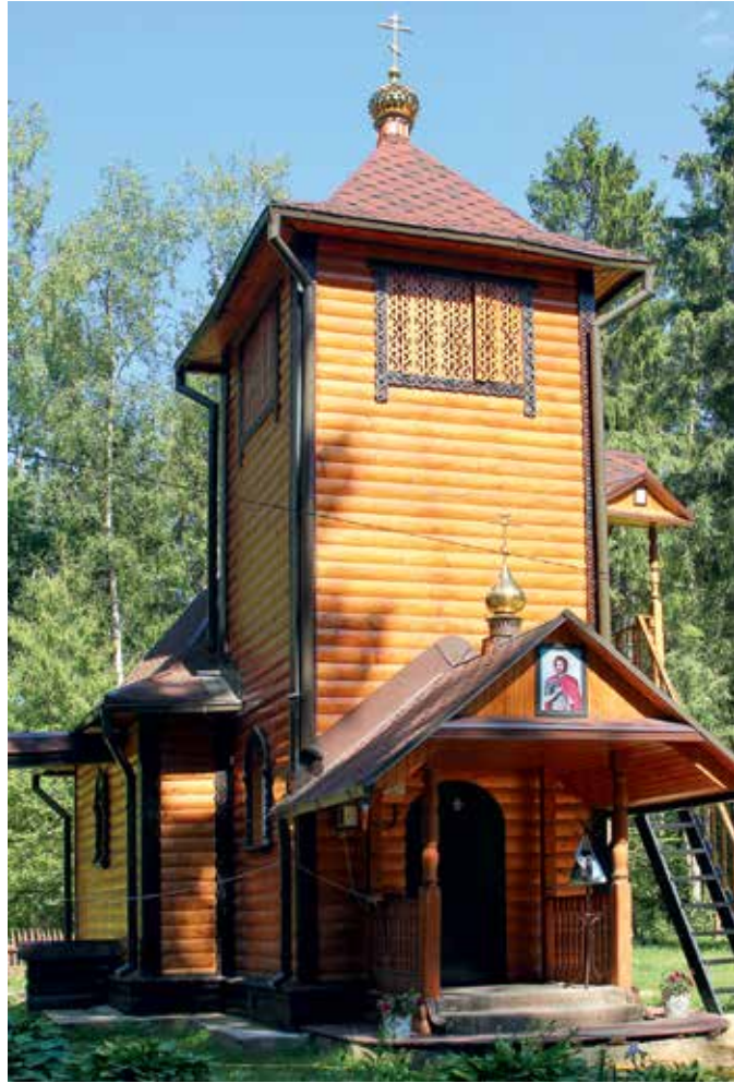
Лесная церковь вмч. Никиты близ деревни Горенки

В означенном направлении виднелась дорога с немного зловещим топонимом «Мурановская петля». Примерно через час пути по ней удалось обнаружить тропинку, уходящую на север в лес. Тут же и стрелки на деревьях подтвердились — проставленные буквально каждые 10 м, они были совсем не лишними, учитывая сильную заболоченность и отчаянно петлявшую тропку. Вывели они меня вскоре к точке, именовавшейся на карте «Лесной церковью». Это оказался деревянный храм во имя великомученика Никиты, воссозданный на месте разоренного во время польско-литовского нашествия скита настоятелем храмового комплекса в соседнем Артемове игуменом Феофаном (Замесовым). «От моста через речку Сумерь близ деревни Горенки тут 800 м, — рассказал сторож Сергей Глазков. — Все стройматериалы на себе приходится носить, газа и света у нас тоже нет. По легенде, перед приходом отряда интервентов, осаждавших Лавру во время Смуты, скитские