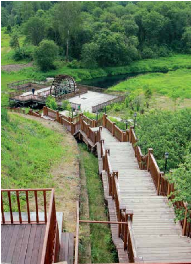
На Святом озере в Радонеже