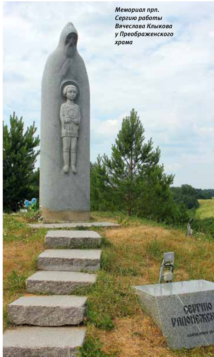
Мемориал прп. Сергию работы Вячеслава Клыкова у Преображенского храма