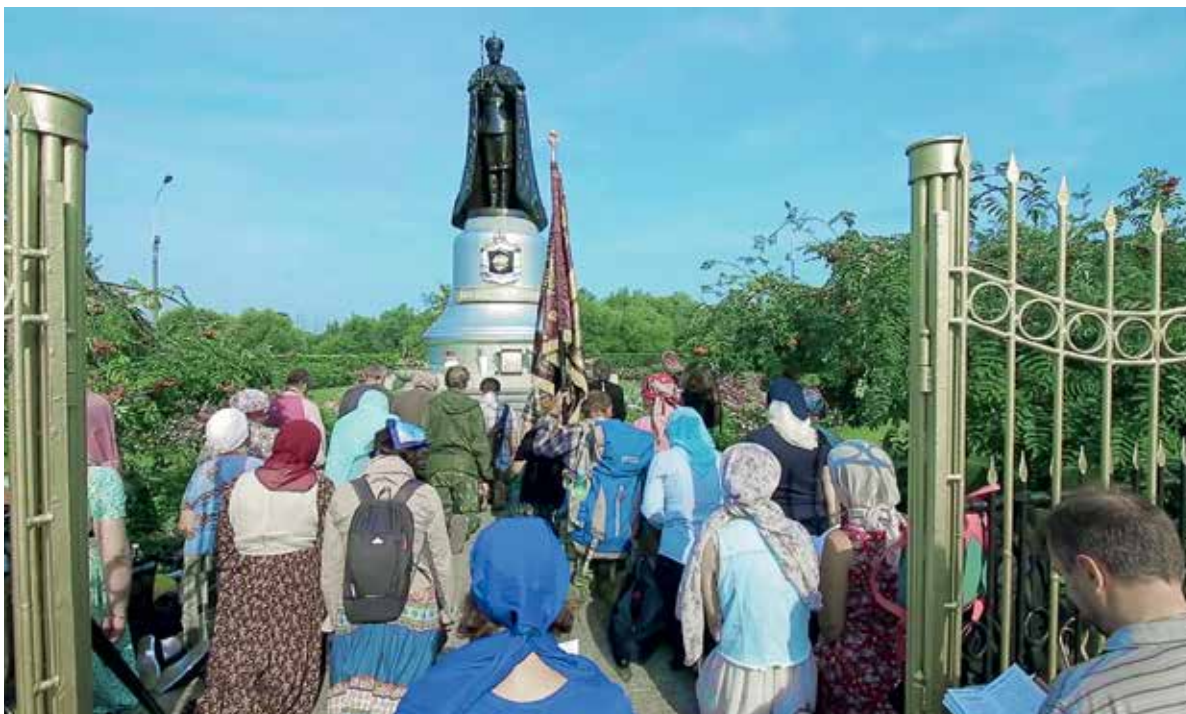
Молебен в Тайнинском у памятника государю-страстотерпцу

Вероятно, не в последнюю очередь по этой причине инициаторы «Дороги» огромное значение уделяют так называемой натурной навигации — синеньким стрелочкам, нанесенным аэрозольной краской на бетонных и железных столбах, спилах и стволах деревьев, опорах ЛЭП и гораздо менее очевидных носителях. Так, однажды я узрел этот знак на... проржавевшем остоле газовой плиты, неведь как и непонятно зачем кем-то брошенной в лесной чащобе