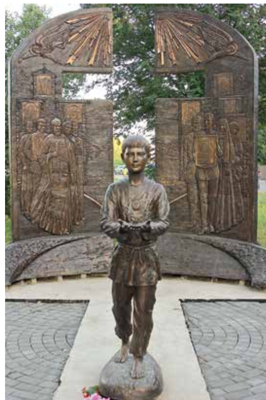
Памятник цареви- чугу- страстотерпцу Алексию Николаевичу словно приглашает на тропу