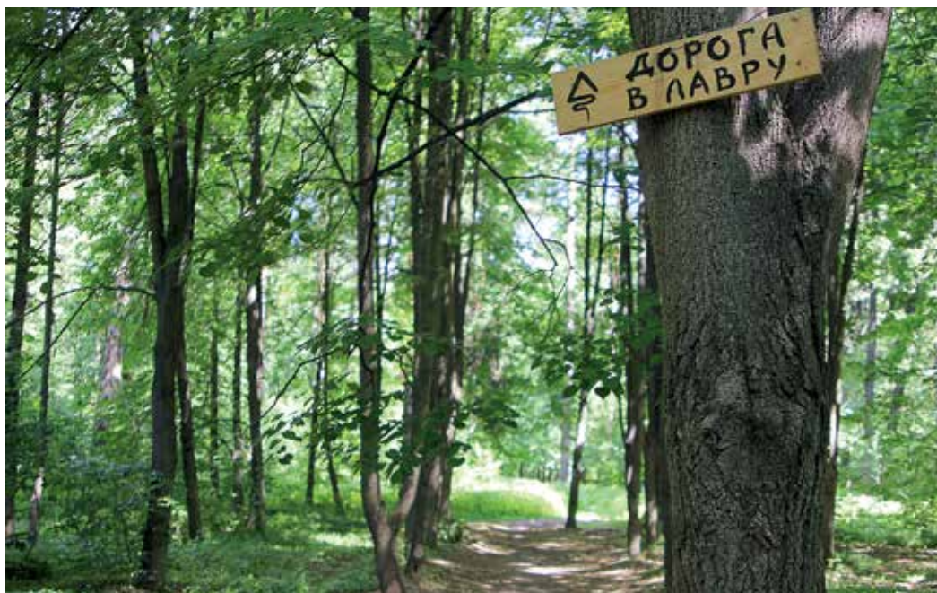
Навигация в лесу