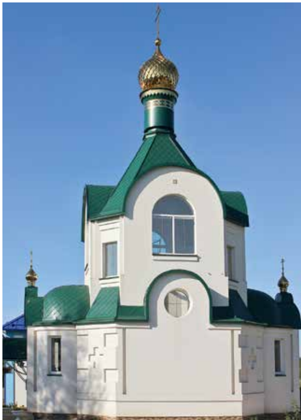
В с. Артемово