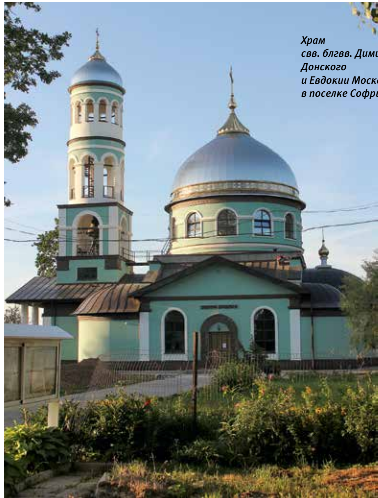
Храм свв. блгвв. Димитрия Донского и Евдокии Московской в поселке Софрино-1