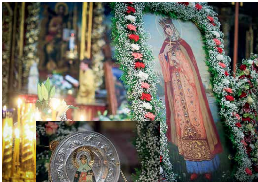
Ковчег с частицей мощей св. княгини Ольги и копия иконы Михаила Нестерова