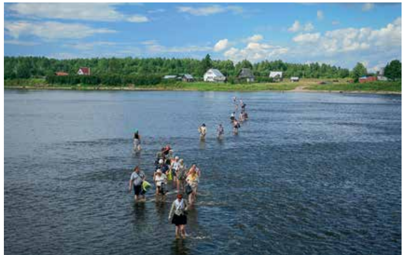
Паломники переходят вброд р. Великую

— Я часто говорю в своих проповедях, что христианство — это терпение. Претерпев до конца — спасешься. Мы часто видим вокруг себя не близких по духу родственников или коллег по работе, и важно не осудить их, не отвернуться. Как поступала эта великая святая. Она не унижала, не оскорбляла людей, которые не достигли ее духовного уровня. Она не назиданиями проповедовала, а терпеливой тихой молитвой. Может быть, в сердце сокрушалась, но тем не менее любовь была выше. И по ее молитве, по ее любви люди, которые, казалось, настолько уко-