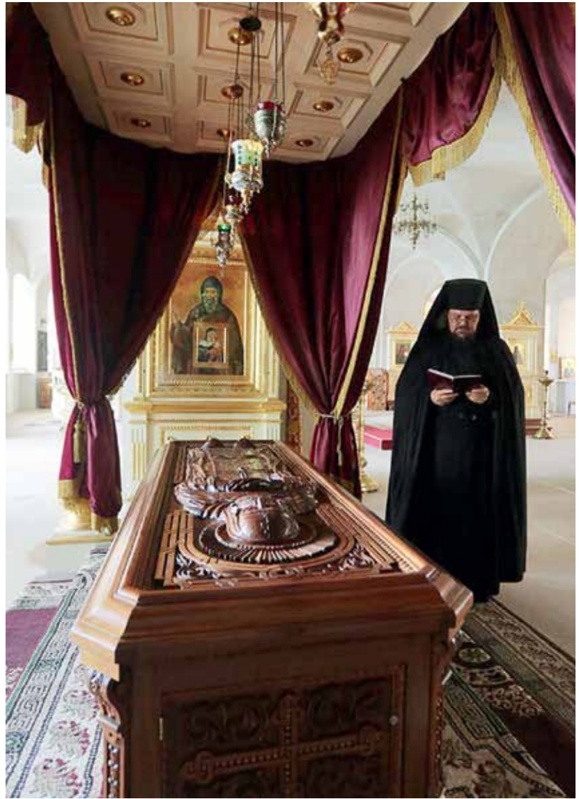
У мощей прп. Арсения Коневского

Работа молодежных лагерей уже давно стала отличительной чертой Коневца. Возвращенное в самом монастыре начинание — ежегодный летний молодежный форум «В начале было Слово» — отнюдь не единственное. У стен Коневского скита ежегодно разворачивается организованный приходом царскосельского Екатерининского собора детский лагерь «Коневец», через шесть смен которого каждое лето проходит около 250 ребят. На мысе Родушка работают молодежные военно-патриотические сборы, по соседству Александровскую пустынь на территории бывшей рыбацкой артели терпеливо