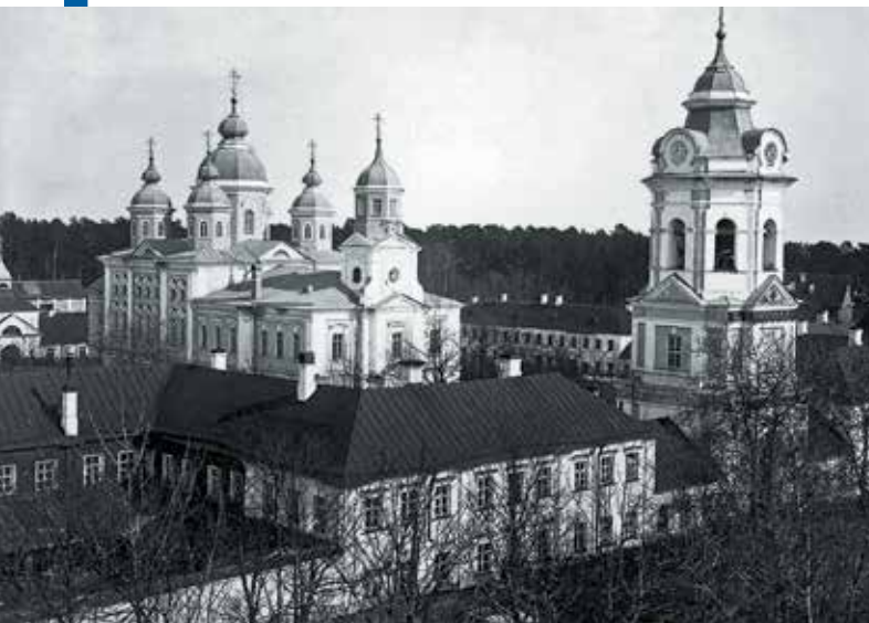
Коневский монастырь. 1930-е гг.