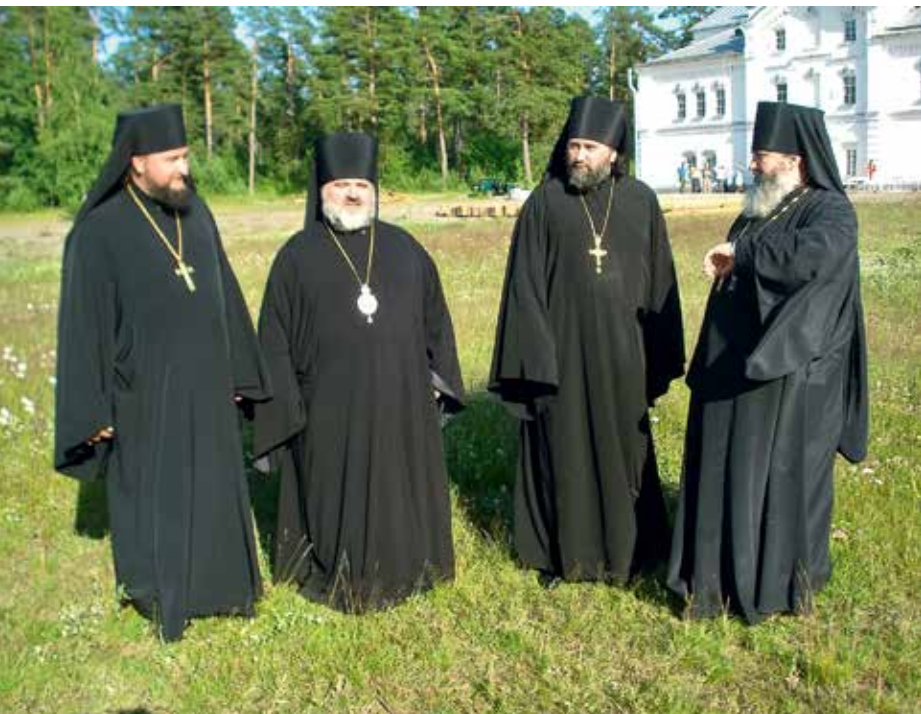
Четыре настоятеля Коневского монастыря