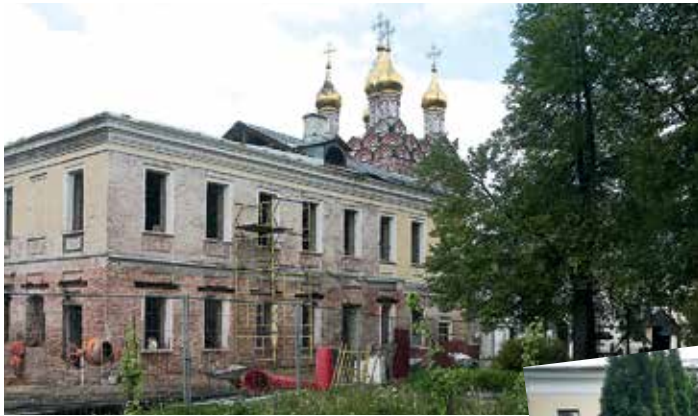
Настоятельский корпус (на втором плане — венчания Надвратной церкви)

Выполнены новые столярные заполнения оконных и дверных проемов, смонтировано отопление. В ходе этих работ вскрыт древний дверной проем, ведущий в каменный переход на столбах к Успенскому собору (разобран в 1785 году). В едином ключе восстановлены алтарные преграды, поновлена отделка стен штукатуркой, проведены вычинка кирпичной кладки и бортовое укрепление настенной живописи. Под слоем поздней штукатурки выявлен старинный белокаменный профиль, следы которого наблюдаются на стенах и на центральном столпе. На будущее лето запланированы консервационно-реставрационные работы по росписи.