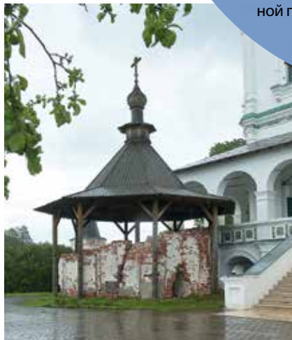
Остов монастырской колокольни

Трапезный комплекс. Самый древний из сохранившихся памятников архитектурного ансамбля обители входит в пятерку крупнейших одностолпных каменных сооружений Древней Руси. Двухэтажная каменная Богоявленская церковь с трапезной палатой и с кладовыми заложена преподобным Иосифом в 1504 году, возводилась на день-