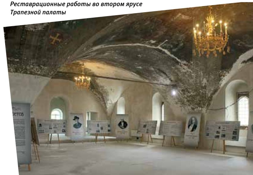
Реставрационные работы во втором ярусе Трапезной палаты