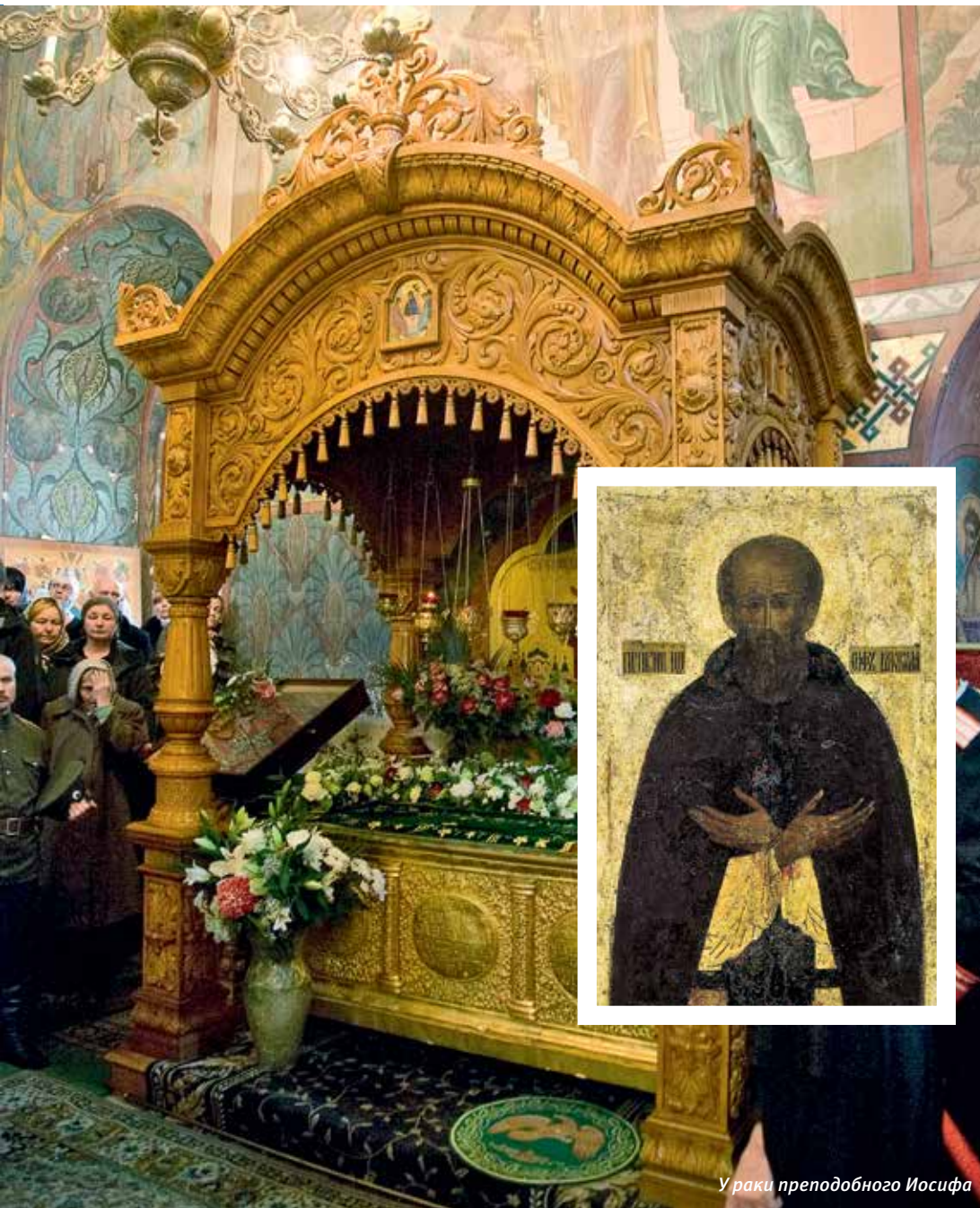
Ураки преподобного Иосифа

та по программе «Культура России». Негосударственный Фонд восстановления Иосифо-Волоцкого монастыря также принял участие в выведении здания Трапезного комплекса с Богоявленской церковью из аварийного состояния. На собранные фондом средства удалось провести работы по просушке подклета, до принятия более серьезных мер по водоотведению.