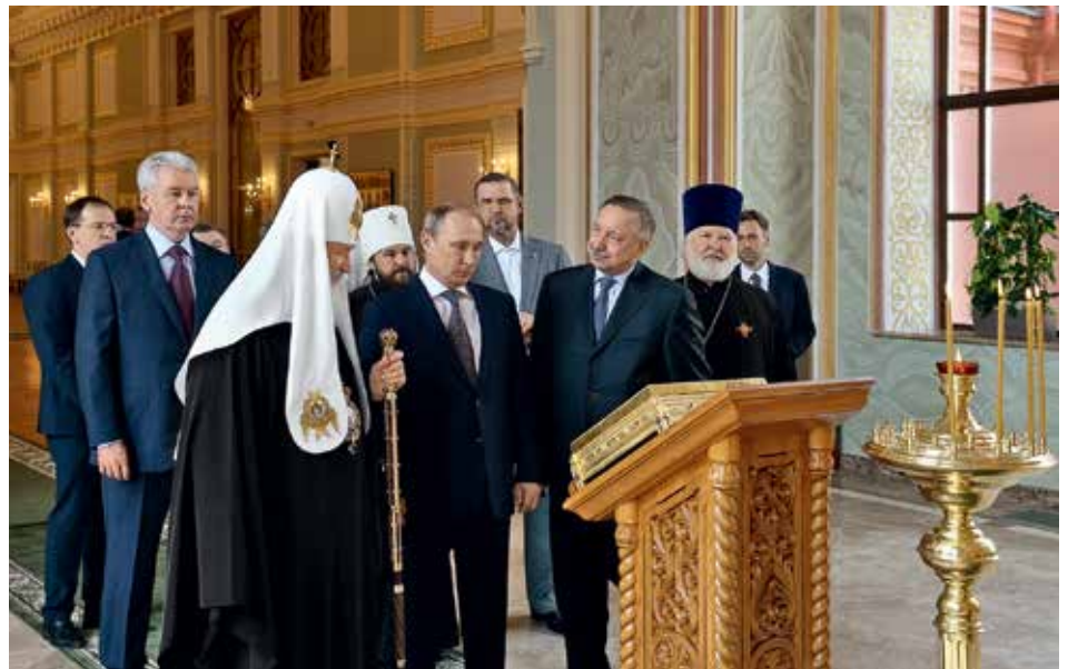
Святейший Патриарх Кирилл и президент РФ Владимир Путин в воссозданной Соборной палате 27 июля 2015 г.

А потом случилась неожиданная история, на несколько лет определившая траекторию развития нашего вуза. Получив первыми среди российских духовных школ лицензию на ведение образовательной деятельности, мы тем самым подтолкнули семинарии и академии к их полной легализации в вузовской системе. Процесс лицензирования в масштабе всей Церкви