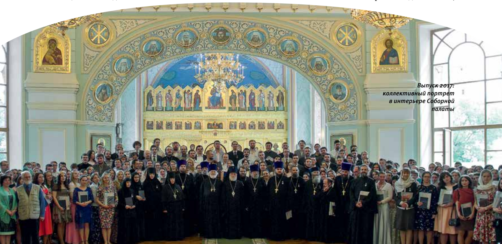
Выпуск 2017: коллективный портрет в интерьере Соборной палаты