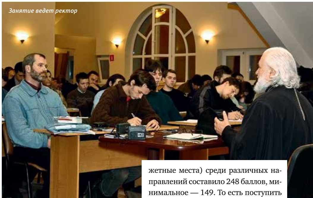
Занятие ведет ректор

Начало истории университета. Одна из первых лекций в ПСТБИ