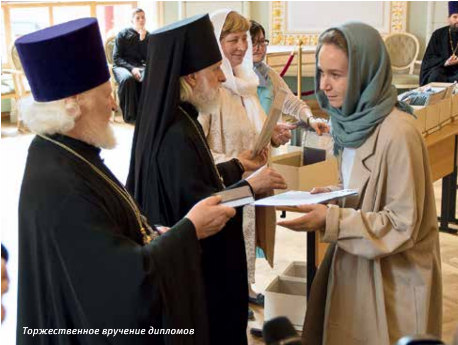
Торжественное вручение дипломов

большая часть которых переводится на русский язык впервые.