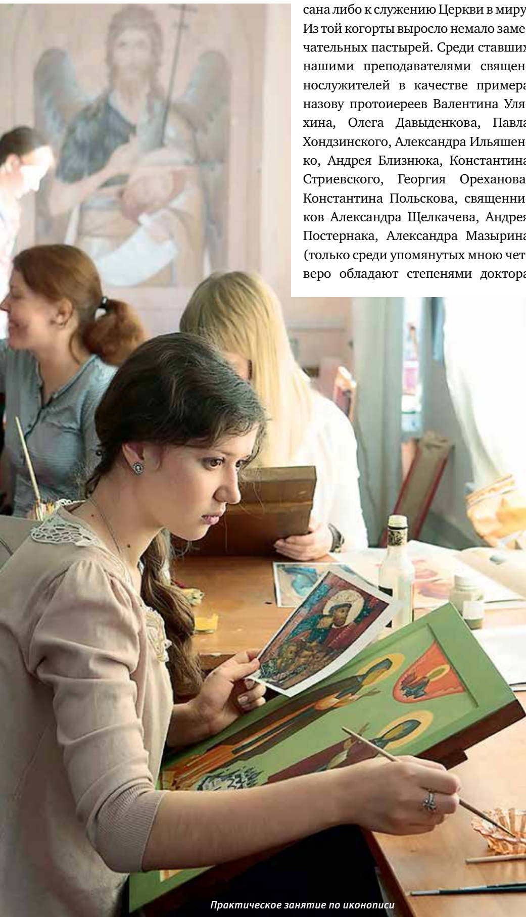
Практическое занятие по иконописи