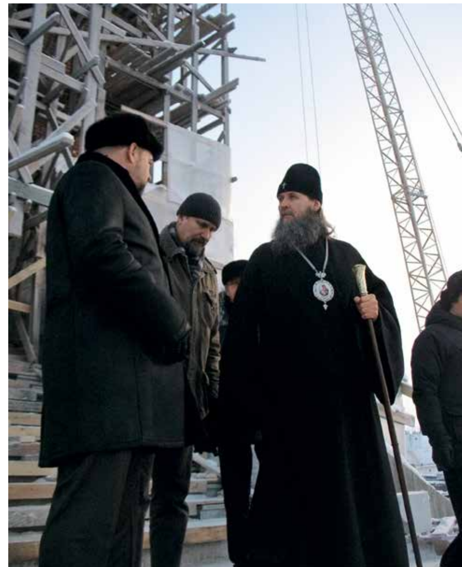
Рабочая планерка на ступенях строящегося Михаило-Архангельского кафедрального собора

Пока ОКН гниют в ожидании денег на ремонт из федеральной казны, архангелогородский бизнес активно жертвует на новый величественный собор в самом центре города. На берегу реки Северная Двина при помощи областных властей и под личным патронатом губернатора уже больше десятилетия возводится величественный кафедральный Михаило-Архангельский собор на три тысячи прихожан. Наружные строительномонтажные работы уже завершены: воздвигнуты купола с крестами, синхронизированы и окончательно настроены пятнадцать колоколов на четырех звонницах, завершена облицовка стен белым мрамором из Коелгинского месторождения (Казхстан). Гранитный камень для покрытия стилобата собора, а также