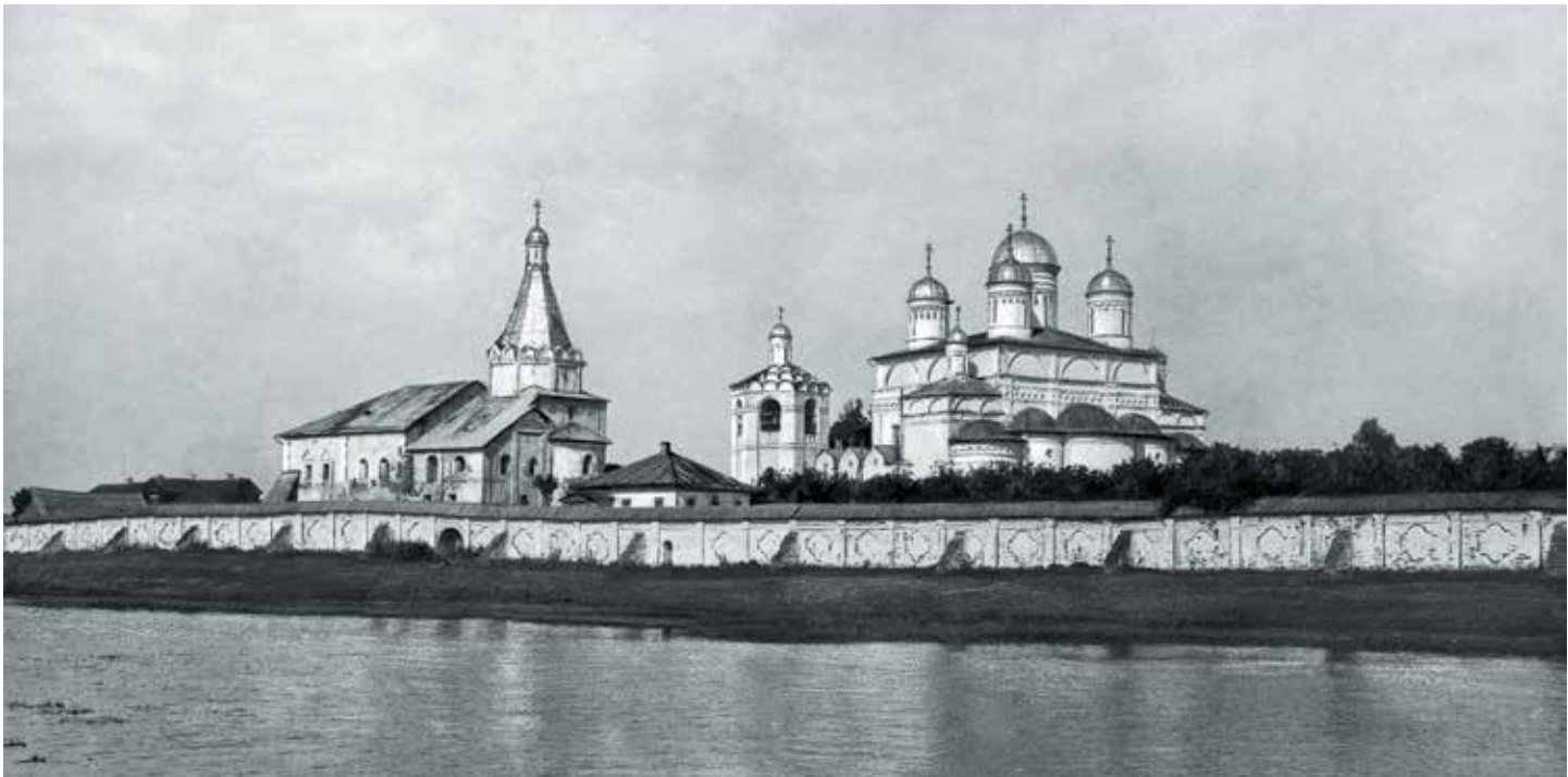
Вид на монастырь перед его закрытием. 1929 г.

стекалось в Болдино на ярмарки, проходившие по престольным праздникам — на Троицын день летом и на Введение во храм Пресвятой Богородицы зимой.