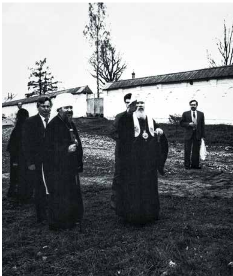
Посещение Свято-Троицкого Болдина мужского монастыря Патриархом Алексием II 3 мая 1993 г. (вверху)