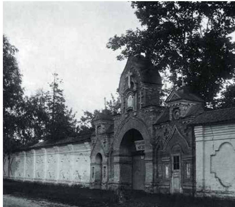
Братия монастыря с игуменом Антонием. 1994 г.