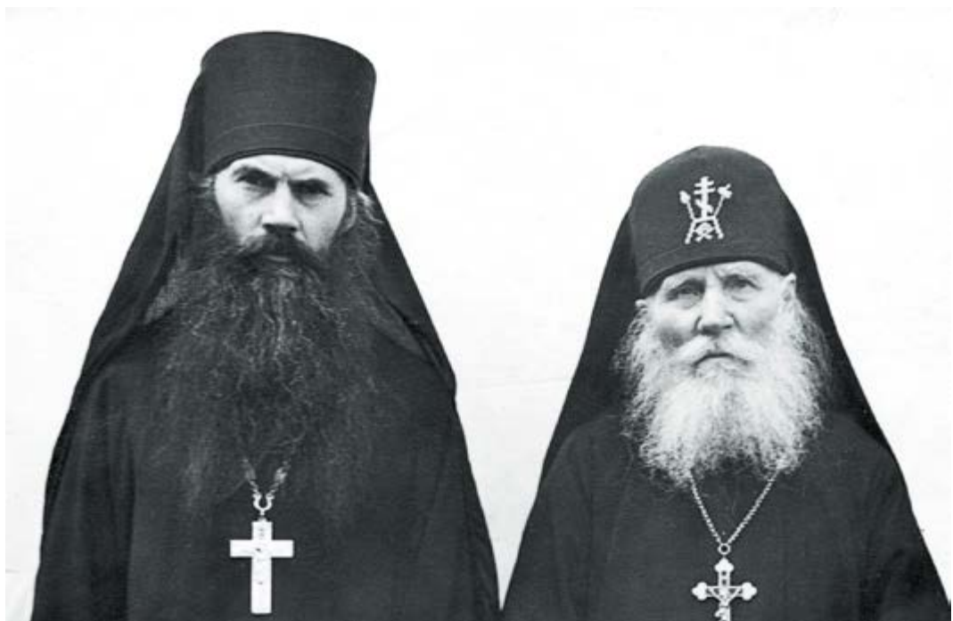
Преподобный иеросхимонах Симеон (Желнин) и архимандрит Серафим (Розенберг)

В молитве следует испрашивать непрерывного памятования о Боге и просить помощи Божией в борьбе с грехом, а также самого дара молитвы: «Проси [у] Бога памяти о Нем и молитвы и помощи в борьбе» 21 . В молитве монаху следует постоянно вопрошать Бога, как ему следует себя вести, что говорить и как поступать по отношению к ближнему: «Молись, указал бы Бог, что сказать, делать, как поступать» 22 . Преподобный подчеркивает, что молитва должна твориться с постоянством и с особой настойчивостью: следует «докучать Богу» 23 .