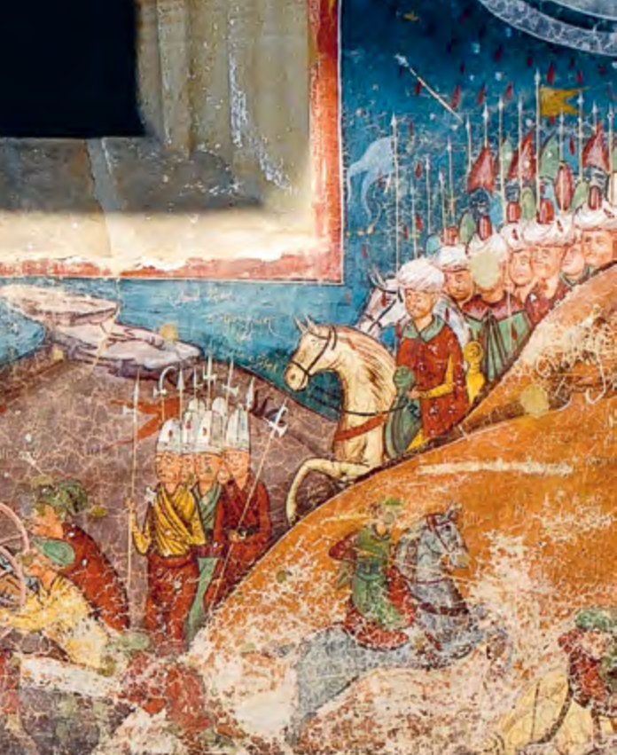
Фрагмент фрески «Взятие Константинополя». Благовещенская церковь монастыря Молдовица, Румыния

ющий главенствующую фигуру во главе любой иерархии. К примеру, в Кьетском документе Совместной православно-католической комиссии по богословскому диалогу говорится, что «понятие первенства обозначает обладание первым местом». Считается, что в Церкви данный принцип изначально реализовался в фигуре предстоятеля на евхаристическом собрании, на основании чего впоследствии возник так называемый монархический епископат, а еще позже, по мере усложнения церковной структуры, развился и институт первых епископов. Невнимание к истории понятия первенства и сведение его лишь к председательству логичным образом ведет к декларированию его богоустановленности в Церкви, поскольку очевидно, что председательство, а вовсе не первенство укоренено в первосвященническом служении Христа и заложено в природе евхаристического священнодействия.