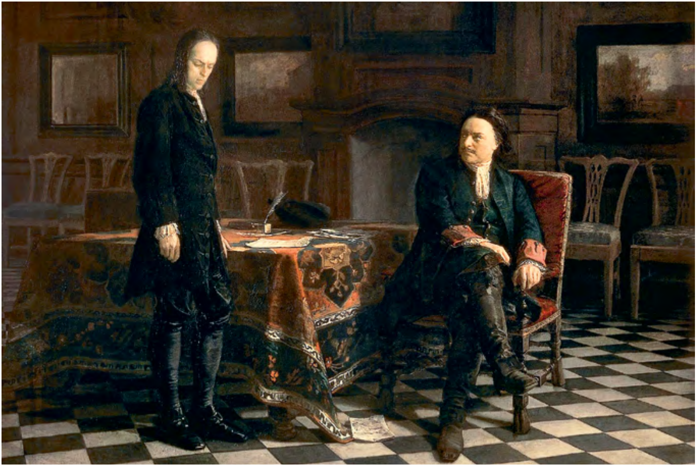
Н. Г. Петр I допрашивает царевича Алексея Петровича в Петергофе

Запрещается «господам» принимать себе в духовники бродячих священников, ибо они или «изгнаны за преступление», или своевольно оставили свой приход.