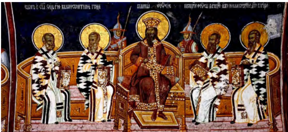
Император Феодосий Великий и Святые отцы Второго Вселенского Собора. Фрагмент фрески притвора монастыря Печская Патриархия, Косово, Сербия. XVI в.

Наречение Патриарха совершал император по формуле: «Святая Троица чрез Ею дарованное нам царство проручествует тебя Архиепископом Константинополя, нового Рима, и Вселенским Патриархом». Остальные архиереи после хиротонии представлялись императору и возносили о нем молитву, чтобы «царь всей христианской полноты... народом святым, царственным священством управлял царственно» (PG. 119, 1160). Кроме этой «типовой», сохранились молитвы, составленные отдельными архиереями. Святитель Григорий Палама говорит в своей молитве о царях: «Ты судил им царствовать над жребием Твоим и над земной Церковью Твоей... Ты поставил их защитниками Церкви, покровителями Твоего наследия, хранителями нашей веры в Тебя» 3 . Об императоре как верховном арбитре и неременном председателе всех догматических Соборов говорит император Феодор II Ласкарис (1254–1258): «...Все Соборы собирались по царским повелениям, ибо царь был имеющим власть их созывать... Когда освященные разногласили о догматах, кто, кроме самого царя, мог бы отличить глаголющих истину?.. Ибо без такового