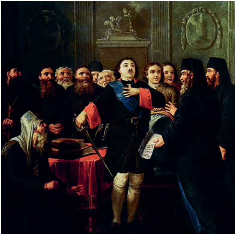
И. Тупылев. Петр I и Святейший Синод

Переломный XVII век был временем большого кризиса Русской Церкви. Вскрывались страшные проблемы церковной жизни, и церковное сознание искало пути их решения. Во многих регионах люди перестали исповедоваться, причащаться, венчаться. Указы царя Алексея Михайловича по поводу таких проблем свидетельствуют о встревоженности монарха. Не объясняет ли такое расцерковление легкость, с какой распространилось староверство беспоповских толков, спустившее число таинств ниже лютеранского минимума?