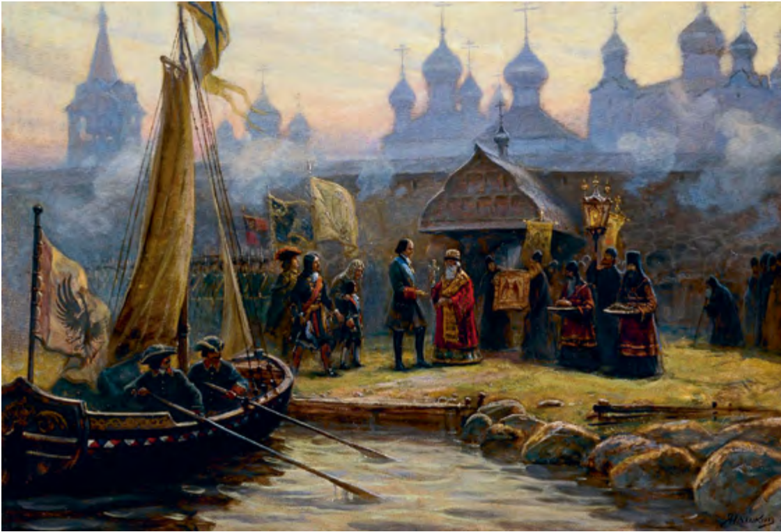
И. Машков. Паломничество царя Петра в Соловецкий монастырь в 1702 г.

огромной территории и малого числа епископских кафедр. Если территория — объективная данность, то малое число епископов объясняется человеческим фактором. Епископам понравилось в беспредельной Руси быть «князьями Церкви», и они препятствовали умножению числа своих собратий, хотя государственная власть хотела, чтобы их было больше. Получилось, что если на Малоазийском полуострове в цветущие времена христианства было примерно 350 епископов, а в совсем небольшой по территории Латинской Африке епископские кафедры тоже исчислялись сотнями, то на Руси едва насчитывалось два десятка епископов. В Римско-Византийской империи развитию соборного института содействовало приспособление Церкви к административному делению государства на провинции (аккомодация). В самом начале IV века, при Диоклетиане, провинций было около ста, в V веке их было уже более ста двадцати. Предписываемая канонами соборная деятельность развивалась именно в пределах провинций, составлявших в силу аккомодации церковные округа во главе с митрополитами. В провинциях с небольшими территориями епископы могли собираться на Соборы дважды в году. Впрочем, впоследствии для уменьшения тягот епископского служения