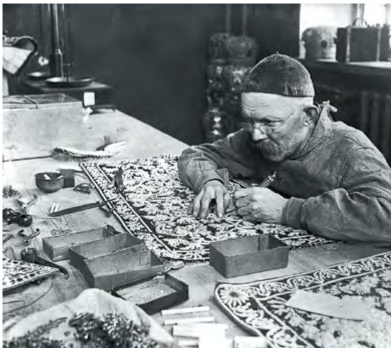
Перед уничтожением с церковного имущества снимались драгоценные украшения. Фото 1920-х гг.