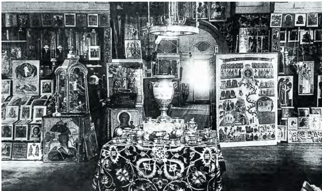
Церковные ценности, выставленные на продажу. Фото 1920-х гг.