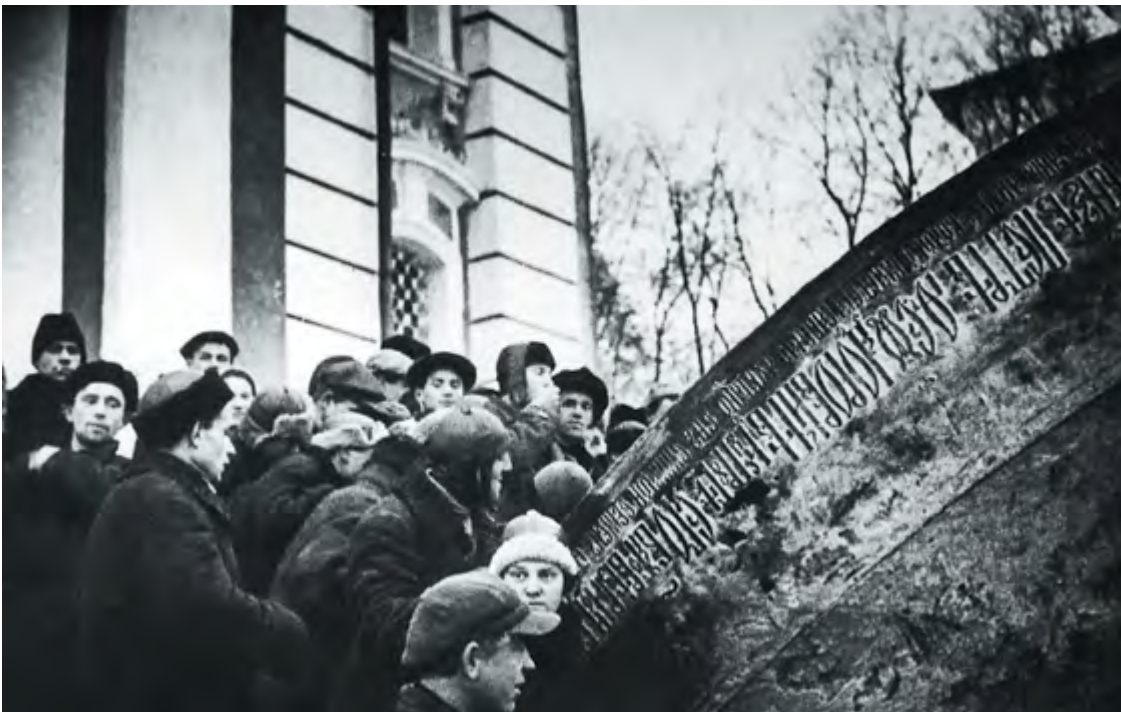
Разбитые колокола Троице-Сергиевой лавры.