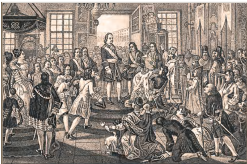
Б. А. Чориков. Провозглашение Петра I императором. Книжная иллюстрация первой половины XIX века

почему-то нередко забывают, что брить бороду (правда, оставляя при этом усы — по образцу польских шляхтичей) стало модным у московской знати уже при царе Федоре, и по приказу именно этого государя в Кремль было запрещено пускать лиц в старом московском платье. Так что Петр Алексеевич отнюдь не изобретал ничего нового, насаждая европейскую моду и быт, но лишь следовал в этом линии своего старшего брата.