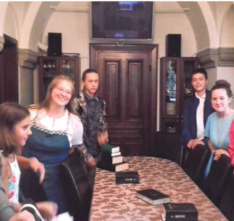
Библейский кружок для подростков на приходе Никольского собора г. Вены