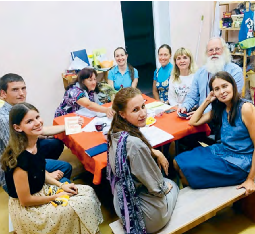
Евангельская группа при молодежном отделе Волгоградской епархии, г. Волгоград

группы уходили по этой причине, так и не сумев преодолеть свою убежденность в том, что только священники должны читать и трактовать Евангелие. Но есть немало тех, кто начинает вместе с нами изучать Благовествование и воспринимает эту практику как действительно живую и необходимую. Такие участники встреч готовы всем вокруг рассказывать, что христианам надо обязательно читать Евангелие, потому что это фундамент нашей веры, без чтения этой книги мы не можем знать Христа, поскольку Он в ней нам открывается. Даже если мы читаем богословские труды, это уже вторично по отношению к Евангелию.