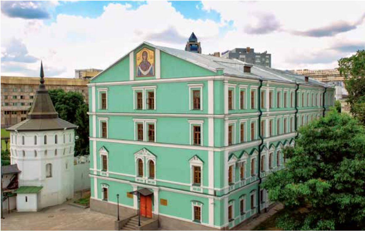
Здание Отдела внешних церковных связей Московского Патриархата (Москва, Даниловский вал, 22)

ОВЦС, осенью 1945 года, когда совершил поездку во Францию для присоединения митрополита Евлогия (Георгиевского) и его викариев, а также митрополита Серафима (Лукиянова) к Русской Церкви. В дальнейшем митрополит Николай возглавлял делегации Московского Патриархата, направлявшиеся в Англию, Румынию, Чехословакию, Венгрию и другие европейские страны. Он же был одним из инициаторов Совещания глав и представителей Поместных Православных Церквей в июле 1948 года, приуроченного к празднованию 500-летия автокефалии Русской Церкви. Проводившаяся митрополитом Николаем подготовка к вступлению во Всемирный совет церквей (ВСЦ), продолжавшаяся более десяти лет, увенчалась вступлением Русской Церкви в эту организацию на тех основаниях, которые он очертил: «Мы соглашаемся... исключительно во имя нашего общеправославного долга — служить воссоединению всех христиан в лоне Христовой Церкви, коей является святое Православие, сохранившее в полноте и целости однажды преподанную святым веру... И именно благодаря ВСЦ голос Православной Кафолической Церкви... может прозвучать на весь мир».