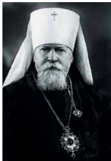
Митрополит Крутицкий и Коломенский Николай, председатель Отдела внешних церковных сношений Московского Патриархата в 1946–1960 гг.

Отдел внешних церковных связей был создан в 1946 году, когда Русская Православная Церковь только начинала восставать из пепла после жесточайших гонений 1930-х годов и тяжелейших испытаний, вызванных войной. За три десятиле-