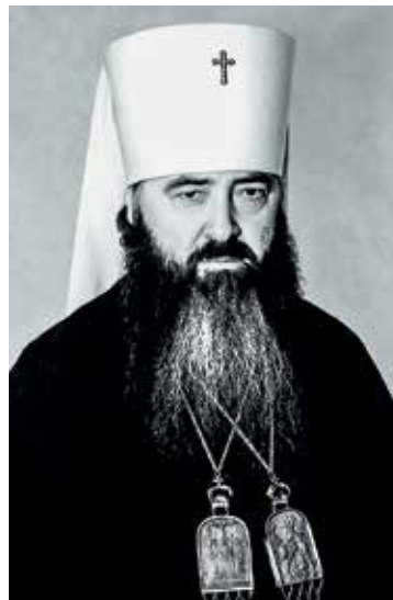
Митрополит Крутицкий и Коломенский Ювеналий, председатель Отдела внешних церковных сношений в 1972–1981 гг.

Священный Синод еще в марте 1961 года постановил, чтобы председатель ОВЦС был в епископском сане и состоял в звании постоянного члена Священного Синода. Это свидетельствовало о большой ответственности, которая возлага-