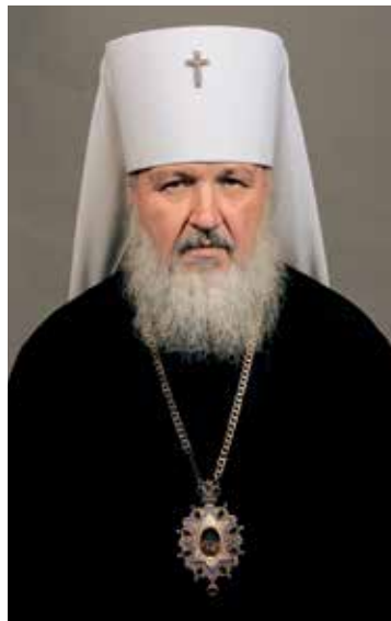
Митрополит Смоленский и Калининградский Кирилл, председатель Отдела внешних церковных связей Московского Патриархата в 1989–2009 гг.

Время, когда митрополит Кирилл возглавлял Отдел внешних церковных связей, стало для Русской Церкви периодом новых испытаний. Рушилась великая страна, на ее территории образовались новые государства. В трагические дни августовского кризиса 1991 года Церковь, обретая общественный авторитет, впервые за многие десятилетия должна была сформулировать свое отношение к текущим политическим событиям, и сделать это в условиях, когда на нее оказывалось сильнейшее давление. Благодаря слаженной работе ОВЦС и его председате-