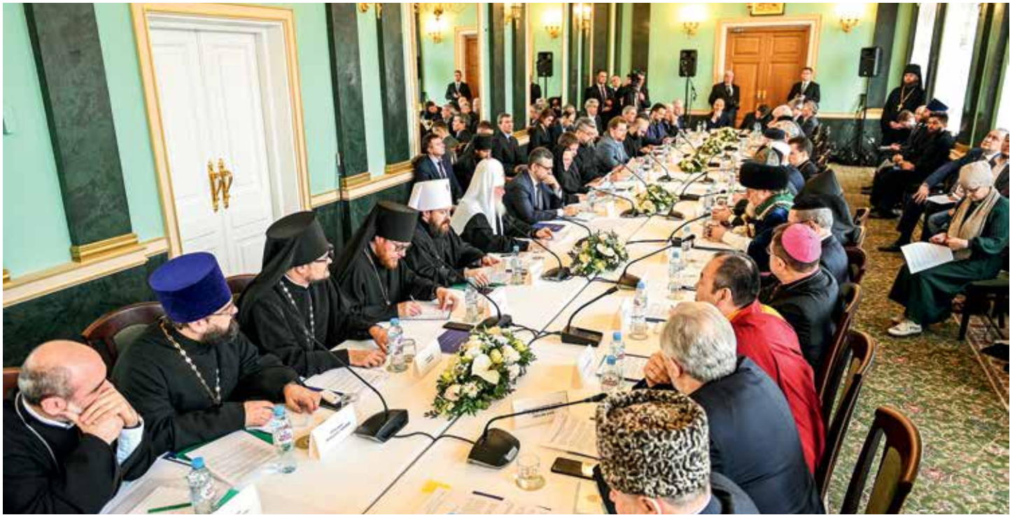
Объединенное заседание Межрелигиозного совета России и Христианского межконфессионального консультативного комитета. 28 февраля 2020 г., Москва

рализма, сохранение мира на земле перед угрозой новой глобальной войны.