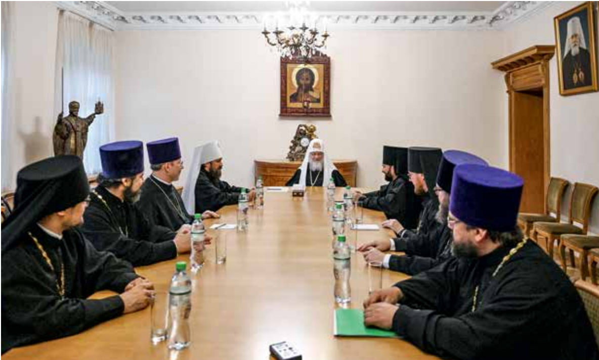
Посещение Святейшим Патриархом Кириллом Отдела внешних церковных связей. 12 сентября 2020 г., Москва

важной составляющей свидетельства нашей Церкви, обращенного к внешнему миру.