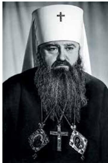
Митрополит Ленинградский и Новгородский Никодим, председатель Отдела внешних церковных сношений Московского Патриархата в 1960–1972 гг.

Следующим председателем ОВЦС стал в 1960 году епископ Подольский, впоследствии митрополит Ленинградский и Новгородский Ни-