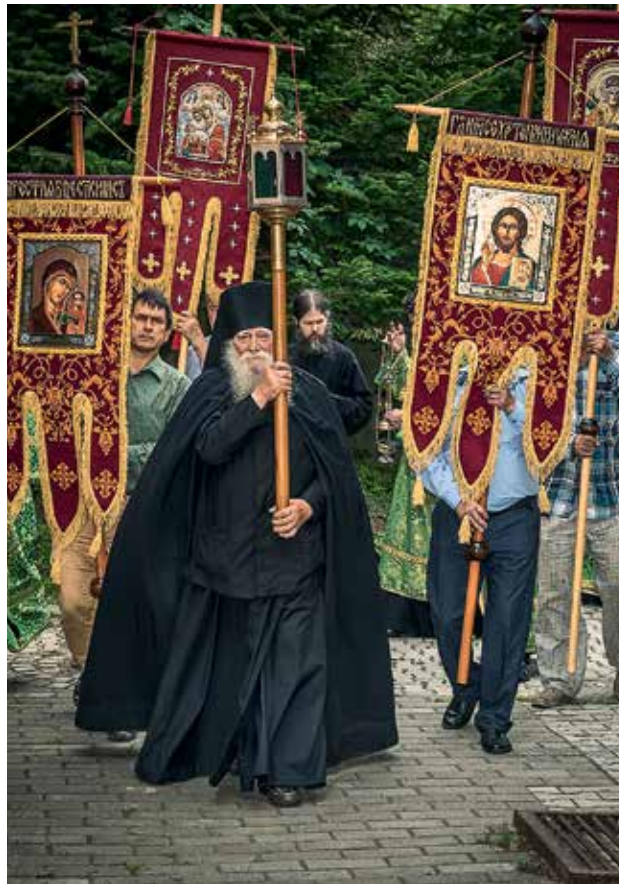
Крестный ход на престольном празднике обители в день прославления преподобного Серафима Саровского

ский некрополь, укреплять склон и сооружать уличную лестницу с ограждениями. В более отдаленных планах строительство еще одного корпуса — административного или игуменского. Там должны разместиться канцелярия, рабочий кабинет и келья настоятеля (эти помещения у нас до сих пор отсутствуют). В подвале этого корпуса планируем сделать погреб с хорошей теплоизоляцией для круглогодичного хранения овощей и других продуктов. И теперь я точно знаю: в новом корпусе нужны автономные печи! В нашем храме 1914 года постройки есть печи, и мы их топим, когда холодно или когда проблемы с электричеством, с котельной. Затем планируем ставить монастырскую стену из кирпича.