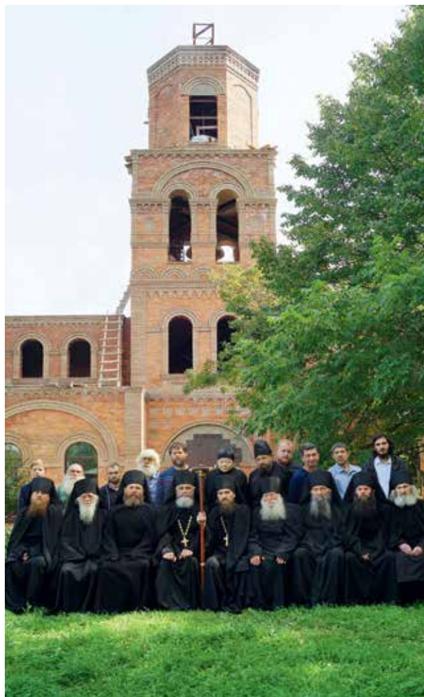
Братия Серафимовского мужского монастыря на фоне строящейся колокольни, август 2018 г.