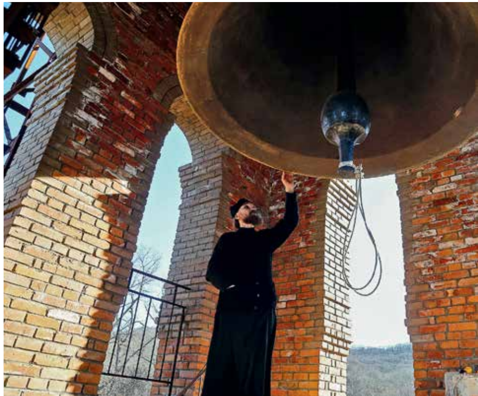
Пятитонный благовестник на монастырской колокольне (вверху)

«В прошлом году Господь посетил нас непростыми испытаниями. Наиболее чувствительным для обители оказался удар стихии: ледяной дождь, обрушившийся на Приморье, оставил островитян без электричества и теплоснабжения и лишил сообщения с материком. Знаменитый мост, соединяющий остров с Владивостоком, закрыли