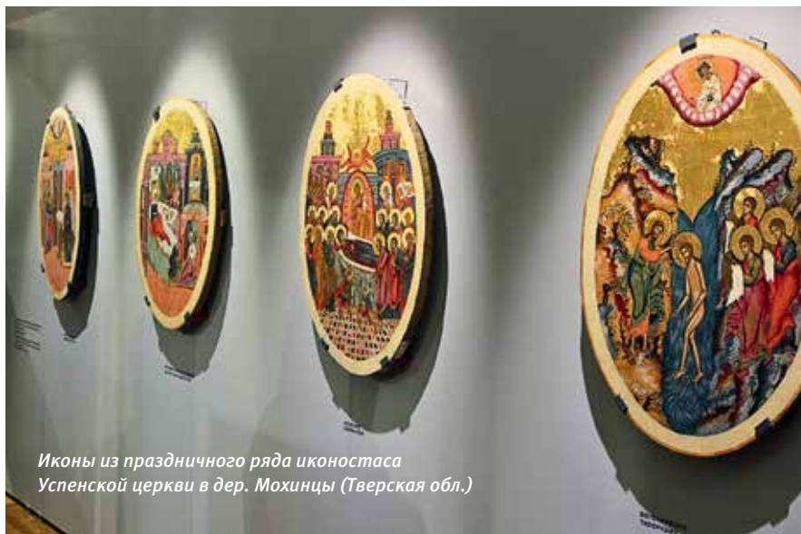
Иконы из праздничного ряда иконостаса Успенской церкви в дер. Мохинцы (Тверская обл.)

Встречи в экспозиции с куратором: 10 сентября и 8 октября в 17.30.