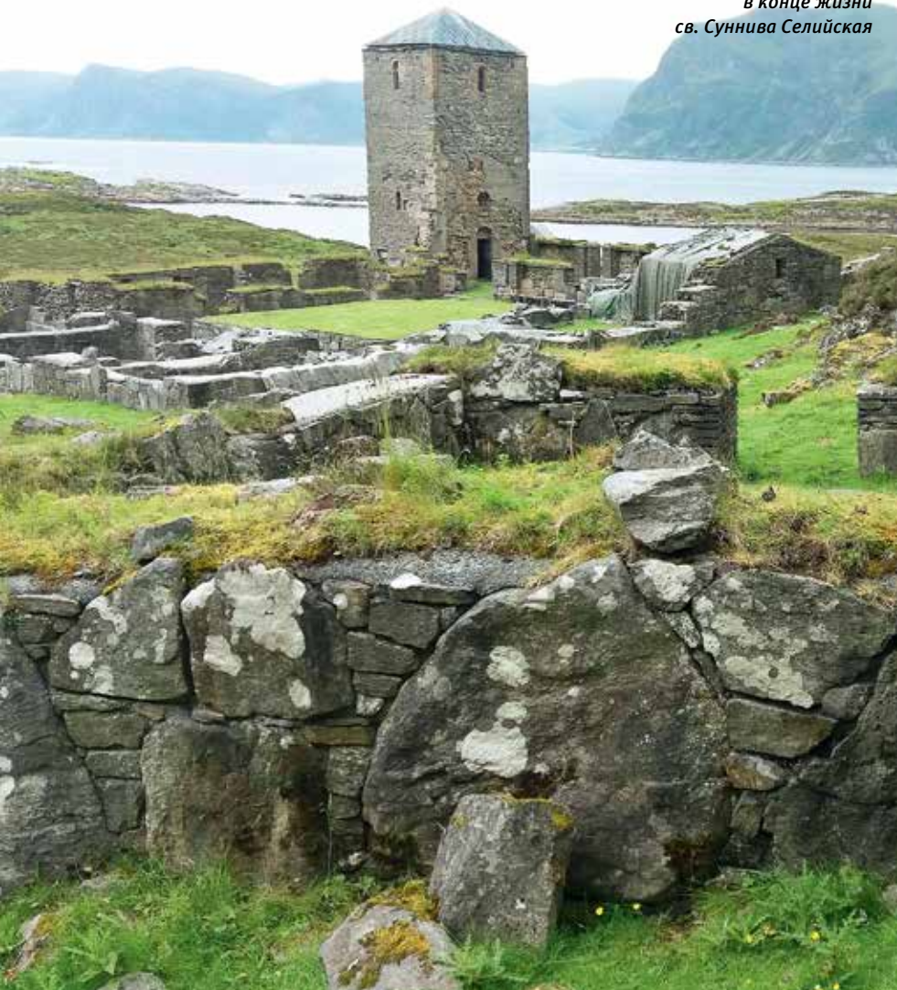
Остров Селье на границе Центральной и Западной Норвегии. Здесь подвизалась в конце жизни св. Суннива Селийская