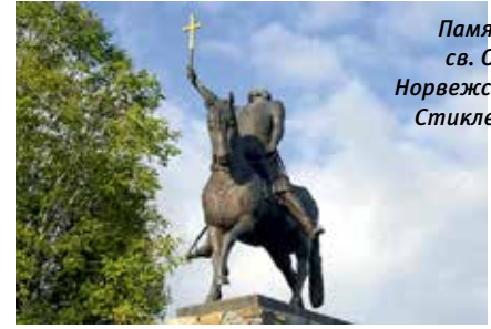
Памятник св. Олафу Норвежскому. Стиклестаде

Олаф II Харальдссон , святой (995–1030), король Норвегии. Память 29 июля. Был викингом, с молодости участвовал во многих морских походах. В 1013 г. принял христианскую веру. В своих походах побывал в Нормандии, Испании и на Святой Земле. В 1016 г. Олаф стал королем Норвегии. Способствовал распространению в Норвегии христианства. В 1027 г. Олаф потерпел поражение от датчан, недовольная его правлением знать подняла мятеж, призвав на трон короля Англии и Дании Кнута Великого. В 1028 г. Олаф с малолетним сыном Магнусом бежал на Русь, где нашел пристанище у великого князя Ярослава Мудрого. Оставив сына на его попечении, в 1029 г. Олаф вернулся в Норвегию и попытался отвоевать свое королевство. 29 июля 1030 г. он погиб при Стиклестаде в битве с мятежным норвежским ополчением и датскими войсками. В 1031 г. прославлен в лике святых и стал почитаться как покровитель Норвегии.