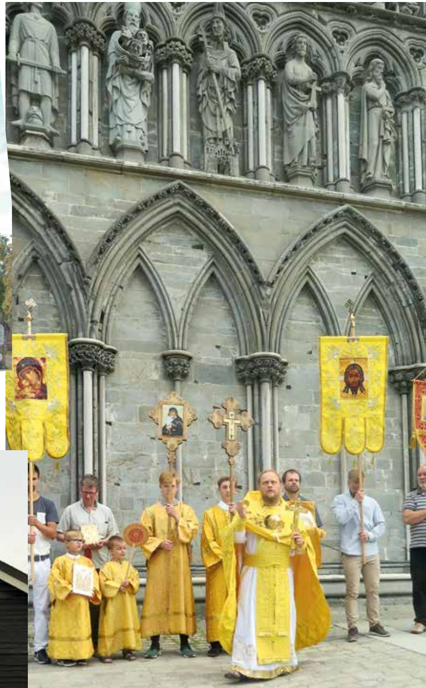
Усыпальница мощей святого Олафа и место коронации монархов Норвегии. Собор Нидаросдомен в Тронхейме