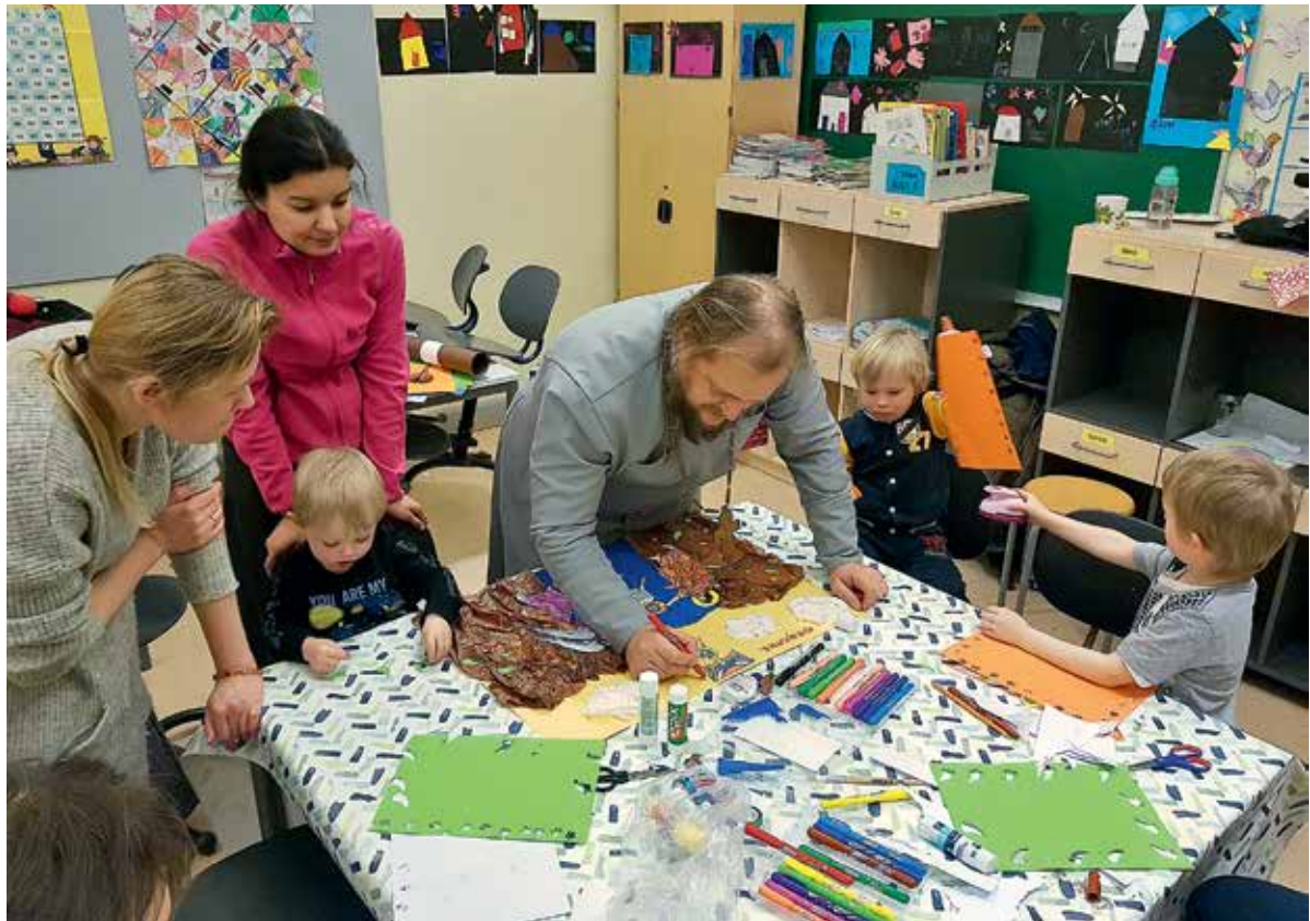
Занятие в приходской воскресной школе для детей в Тронхейме

Большинство — это люди, ищущие в Церкви именно единства жизни с Богом и своими единоверцами. Хотя есть и те, кто первое время за границей нуждается в некоей опоре.