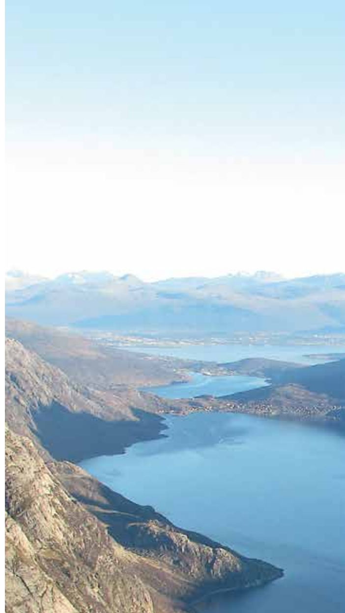
Город Олесунд в Центральной Норвегии, губерния Мёре и Румсдал