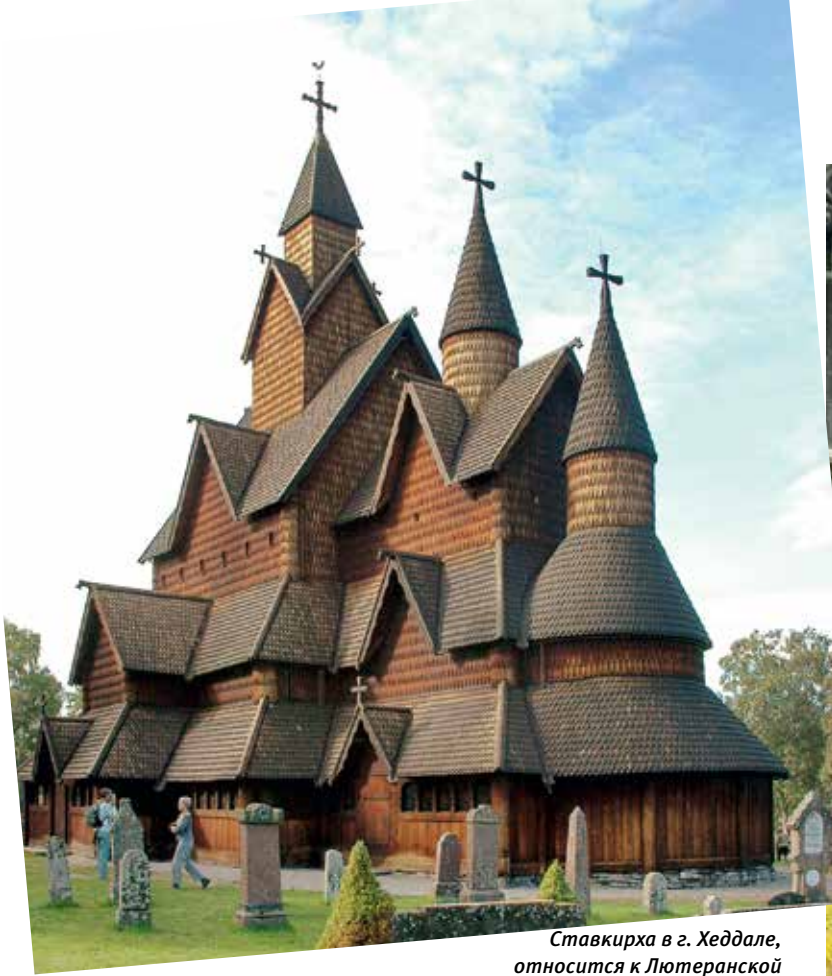
Ставкирха в г. Хеддале, относится к Лютеранской Церкви. Дата строительства предположительно — 1200 г.