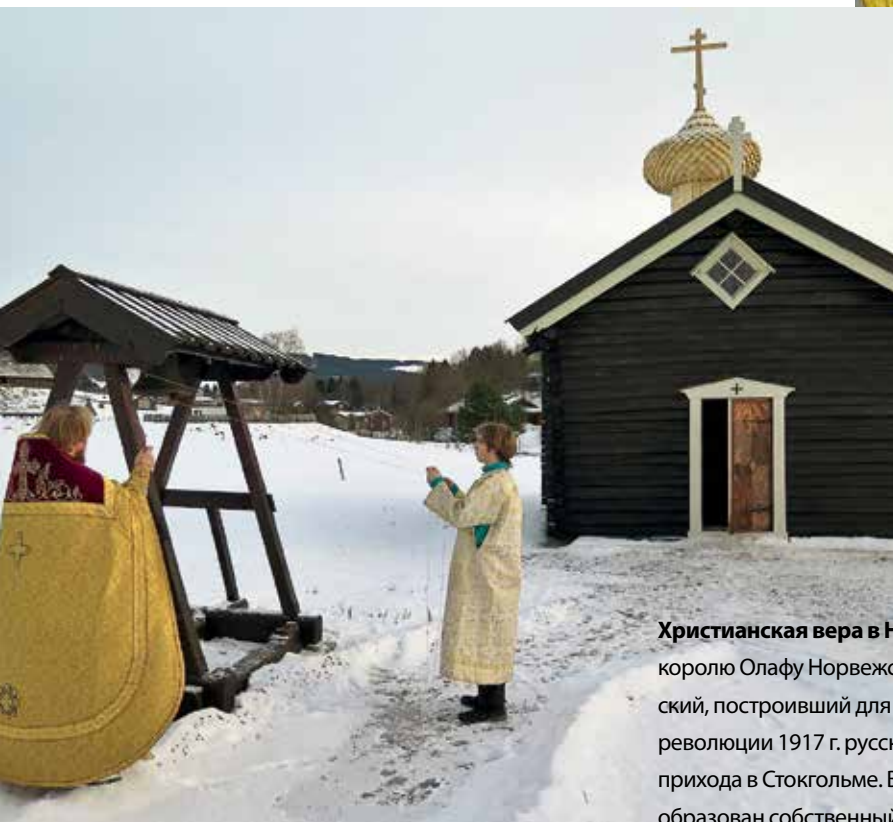
Храм Русской Православной Церкви в честь св. Олафа Норвежского в Стиклестаде

Христианская вера в Норвегии получила распространение еще в X в. благодаря святому королю Олафу Норвежскому. В XVI в. на Норвежской земле подвизался святой Трифон Печенский, построивший для народа саами православную часовню на реке Нейденельва. После революции 1917 г. русских беженцев в Норвегии окормляло священство православного прихода в Стокгольме. В 1996 г., в связи с наплывом эмигрантов из бывшего СССР, в Осло был образован собственный приход — во имя святой равноапостольной княгини Ольги — юрисдикции Московского Патриархата. Сегодня общее число прихожан составляет около 7 тыс. человек. наших соотечественников окормляют три священника, постоянно проживающие в Осло, в Бергене и Тронхейме, а в Киркенес приезжает служить священник из Мурманска.