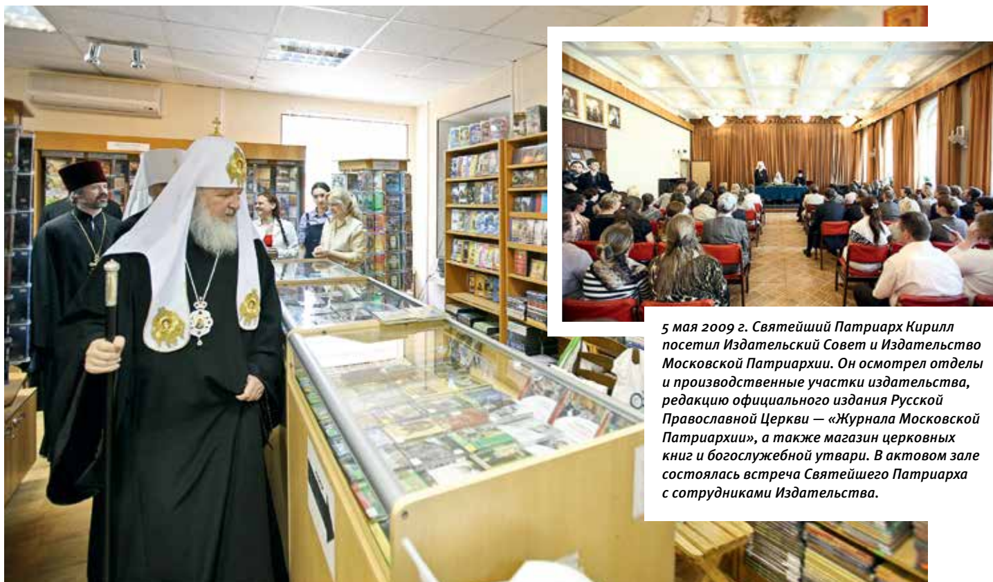
5 мая 2009 г. Святейший Патриарх Кирилл посетил Издательский Совет и Издательство Московской Патриархии. Он осмотрел отделы и производственные участки издательства, редакцию официального издания Русской Православной Церкви — «Журнала Московской Патриархии», а также магазин церковных книг и богослужебной утвари. В актовом зале состоялась встреча Святейшего Патриарха с сотрудниками Издательства.

путей возрождения православного отечества, обсуждению общественных проблем с православных позиций. Стали печататься материалы о мучениках, исповедниках и подвижниках благочестия XX века, статьи о религиозных взглядах деятелей русской культуры. Стали появляться материалы из богатейшего наследия русской богословской и религиозно-философской мысли XX века (в том числе из наследия русской эмиграции), а в рубрике «Церковь и общество» — статьи по всем сферам социального служения Церкви: благотворительности, взаимодействию с Вооруженными силами, работе с молодежью, миссионерской деятельности и другие.