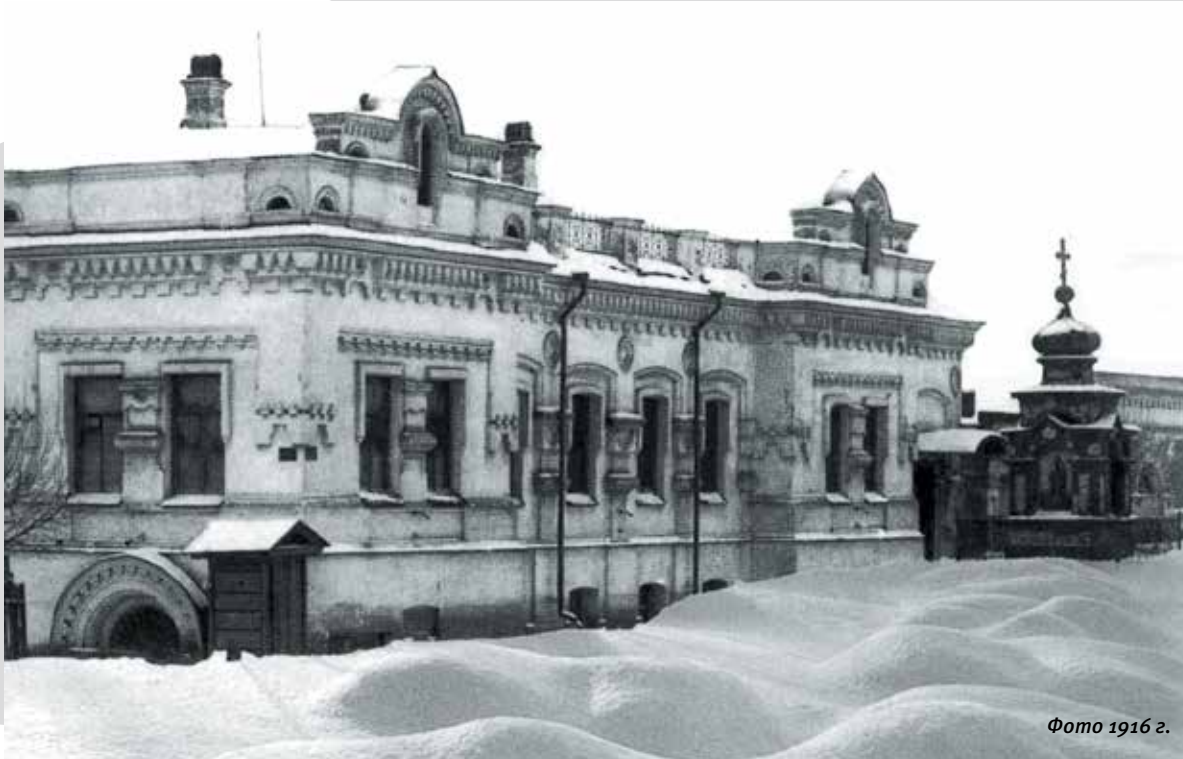
Фото 1916 г.