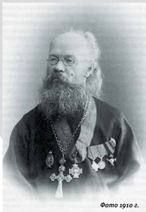
Фото 1910 г.