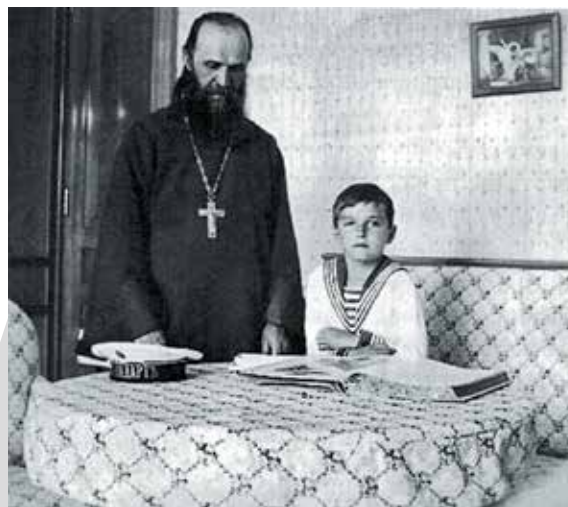
Петергоф. 1912 г.

6 августа царская семья на пароходе «Русь» прибыла в Тобольск, а 13 августа переселилась в дом губернатора. Но прийти на богослужение в церковь им разрешили только 8 сентября (на праздник Рождества Богородицы). 13 августа государь пишет в дневнике: «В 12 час <ов> был отслужен молебен, и священник окропил все комнаты Св<ятой> водой». Певчими были