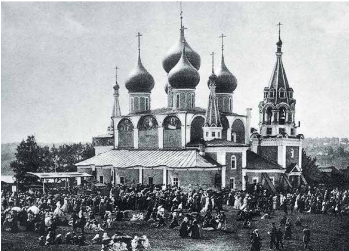
Крестовоздвиженский собор. Романов-Борисоглебск XVII в. (слева)