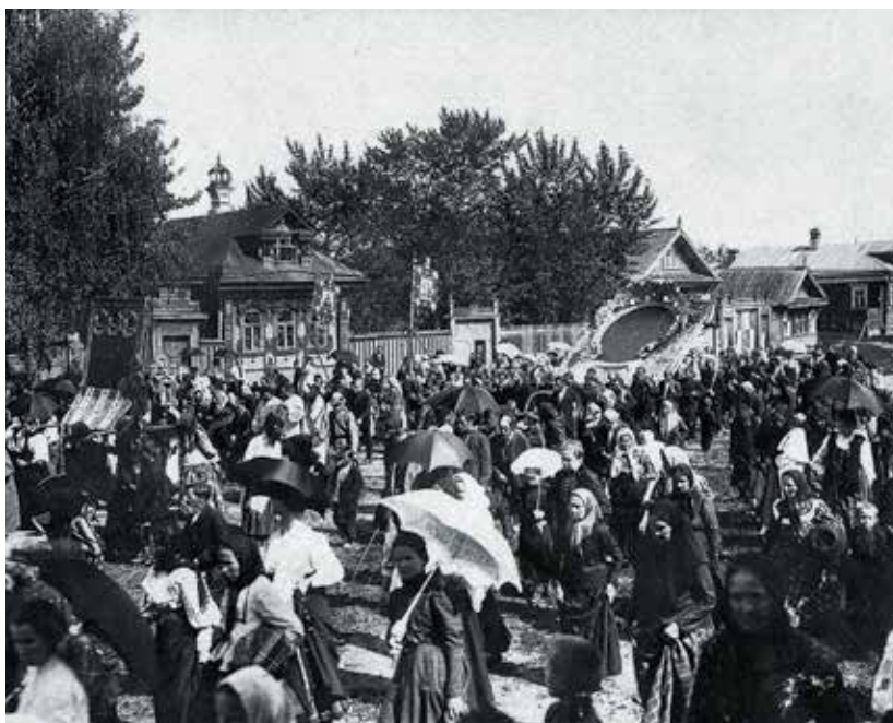
Крестный ход со Спасом (внизу). Фото кон. XIX нач. XX в.