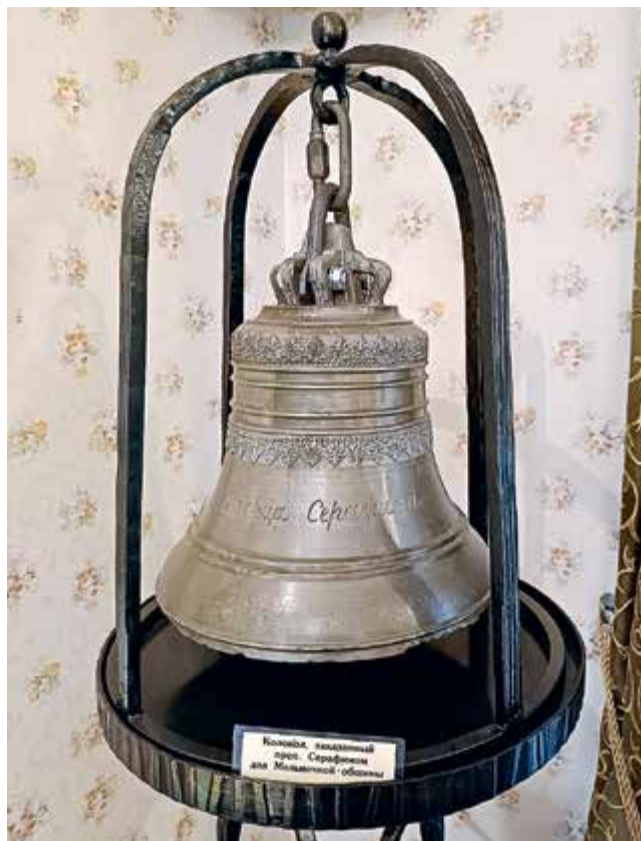
Колокол, заказанный преподобным Серафимом (Саровским) для Мельничной общины. Дом-музей блаженной Паши Саровской (справа)