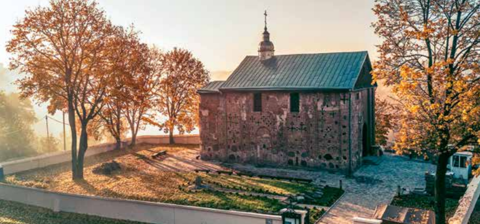
Коложская Борисоглебская церковь. XII век

жалению, не сохранилось ни одного изображения первоначального храма. Самое раннее его изображение — на гравюре Маттиаса Цюндта, изготовленной в 1568 году в Нюрнберге. Там храм изображен весьма условно. До революции, в советское время и сейчас делались попытки восстановить исторический облик Коложи. Один из таких вариантов был взят за основу для строительства нового храма в одном из микрорайонов Гродно. Архитекторы, изучив все данные, создали вариант реконструкции Коложской церкви — примерно такой, какой ее могли видеть в XII веке. На основе этой реконструкции мы возводим новую Коложу в стиле гродненской архитектурной школы.