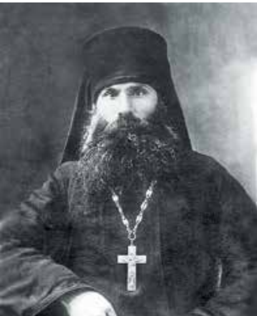
Архимандрит Серафим (Шах- мутъ) в 1930-е гг. (слева)