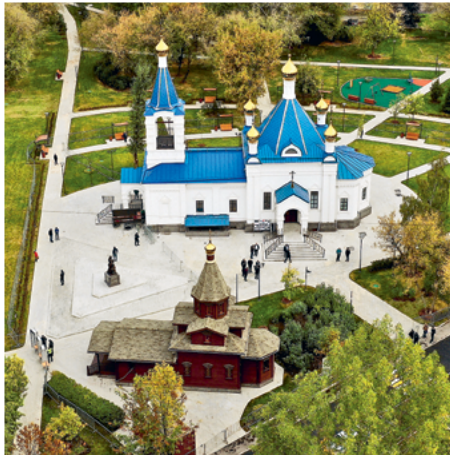
Храм-часовня сщмч. Иоанна Восторгова в Останкине