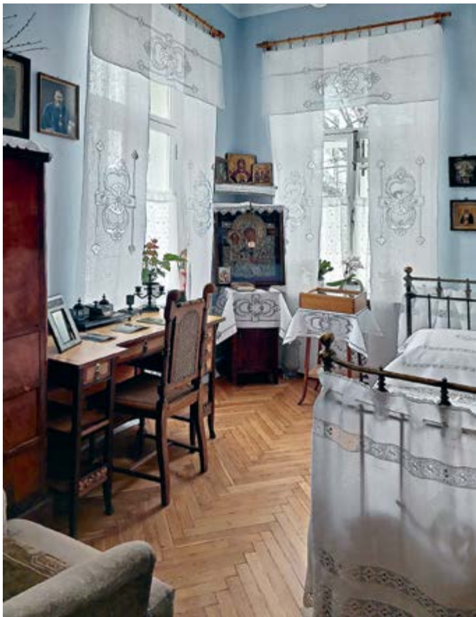
Келья святого праведного Алексия Мечёва (слева)