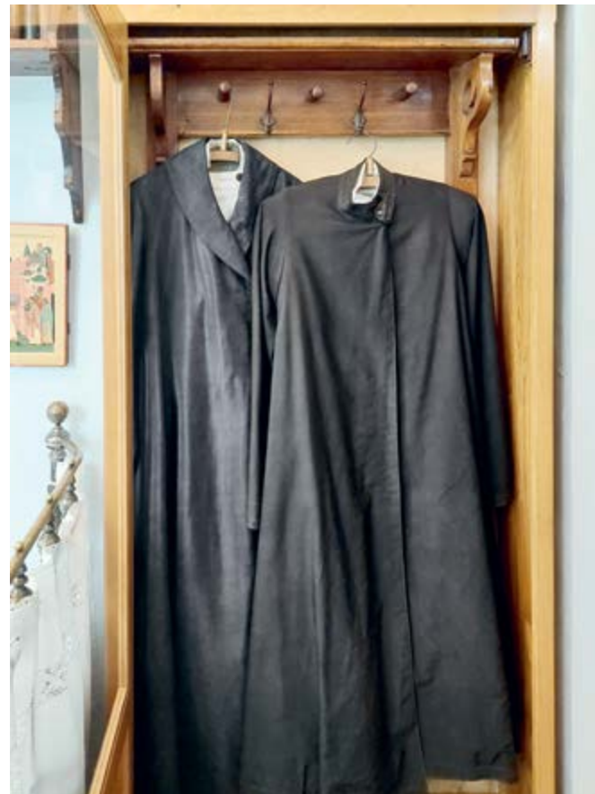
Облачения святого праведного Алексия Мечёва и священно-мученика Сергия Мечёва (справа)

количество людей, заполонивших всю улицу, так что по Маросейке нельзя было проехать. Хоронили отца Алексия на Лазаревском кладбище, и туда приехал Патриарх Тихон, только освободившийся из внутренней тюрьмы ОГПУ. Он же и отслужил литию по усопшему пастырю.