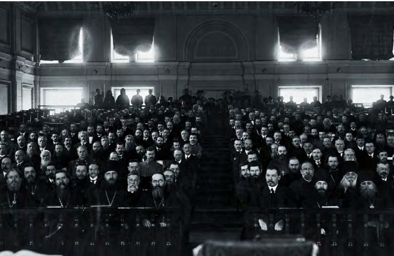
Поместный Собор 1917–1918 гг.

материала, отсутствие журналистской или экспертной аналитики были связаны с недостатком информации, вызванным закрытым характером работы Совещания. Впрочем, некоторые издания брали у церковных иерархов интервью, которые позволяли читателям познакомиться с мнениями членов предсоборного органа. Так, «Петербургская газета» в статье «Восстановление патриаршества» 27 апреля 1912 года опубликовала беседу корреспондента с архиепископом Волынским Антонием.