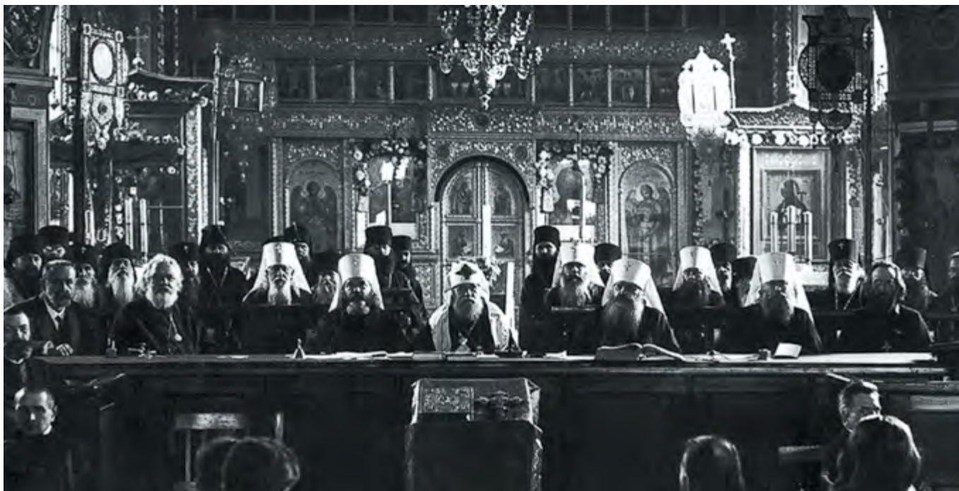
Поместный Собор 1917–1918 гг.