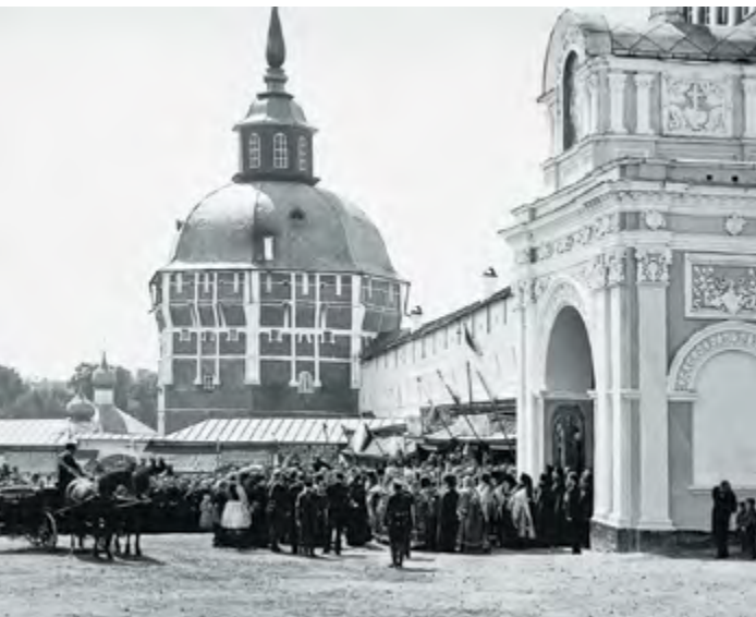
Посещение Свято-Троицкой Сергиевой лавры Императором Александром III. 1883 г. (слева)