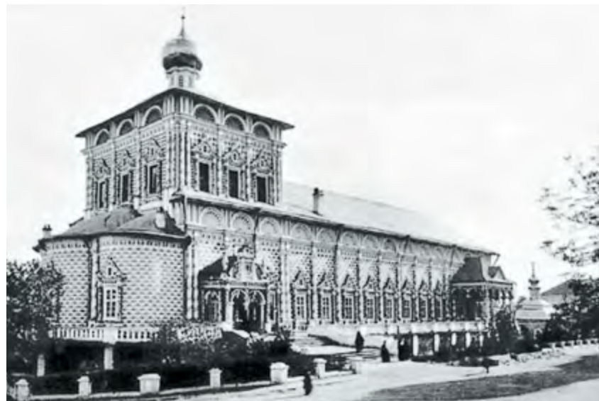
Трапезный храм Свято-Троицкой Сергиевой лавры. 1890 г. (справа)

Первые годы служения в Лавре оказались ознаменованы рядом торжественных событий. Так, в 1878 году отмечалось столетие 1-го Московского кадетского корпуса, в котором обучался архипастырь. Лаврский наместник принял участие в праздничных богослужениях, а также обнаружил связанные с дорогим его сердцу учебным заведением некоторые исторические материалы.