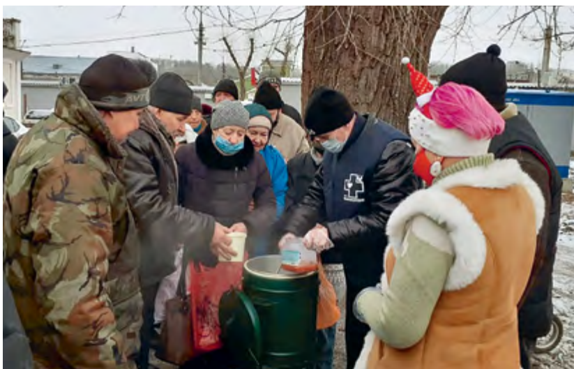
Проект «Смоленское долголетие» — клуб для граждан пенсионного возраста» (вверху)