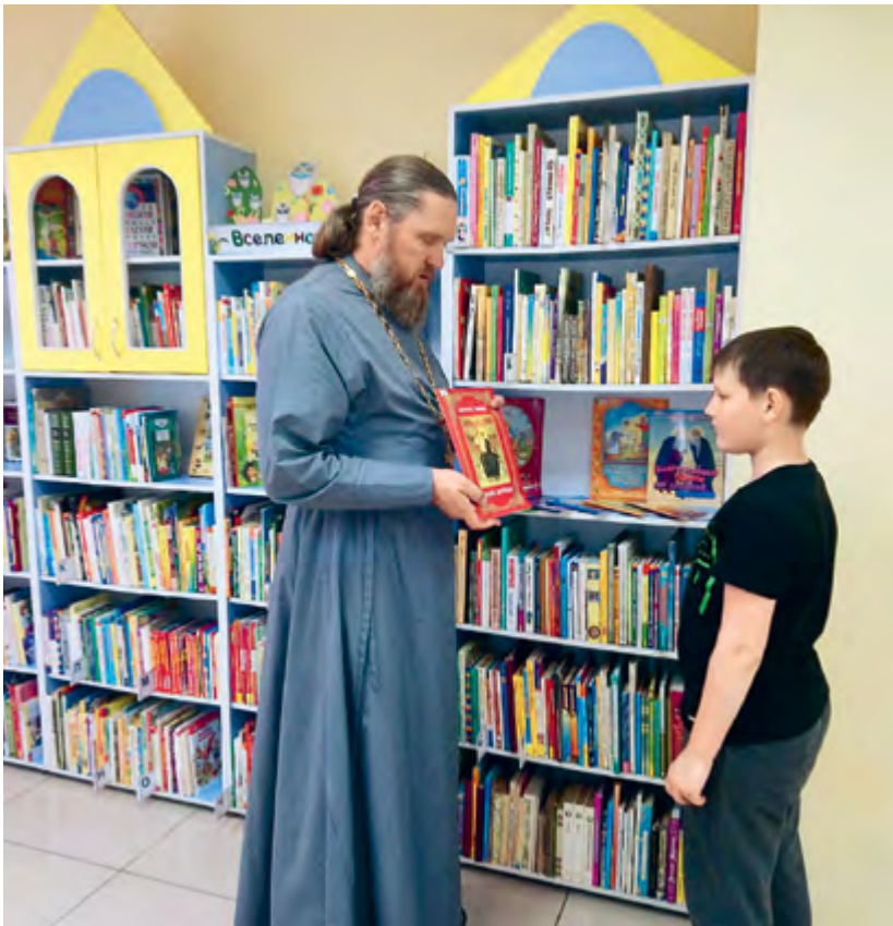
Проект «Родному поселку — чистое слово», посвященный профилактике сквернословия в молодежной среде. Омск, Центральная библиотека им. Н. П. Разумова

— Иногда приходится слышать о страхе перед финансовой отчетностью по гранту, что сдерживает желание в нем участвовать.