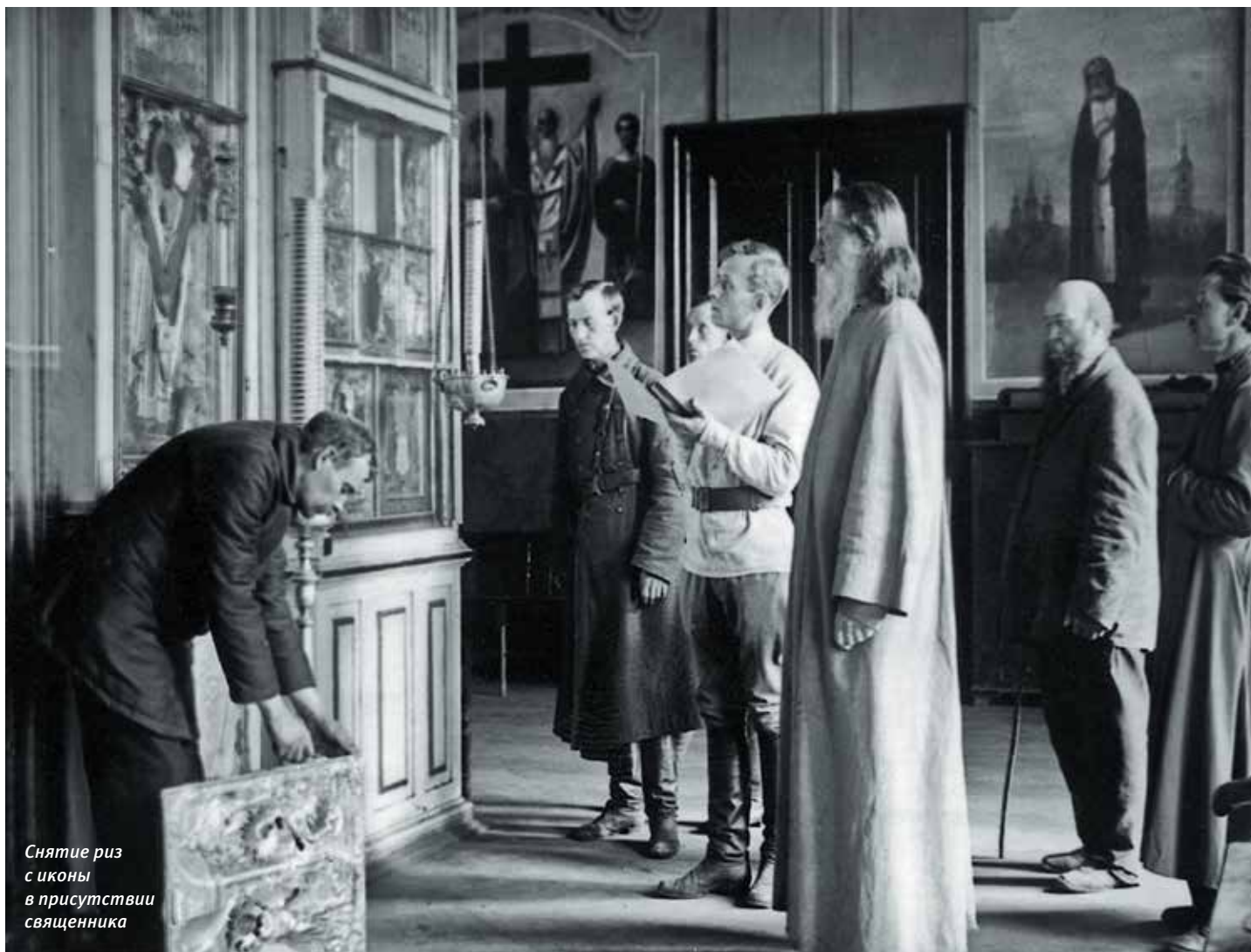
Снятие риз с иконы в присутствии священника