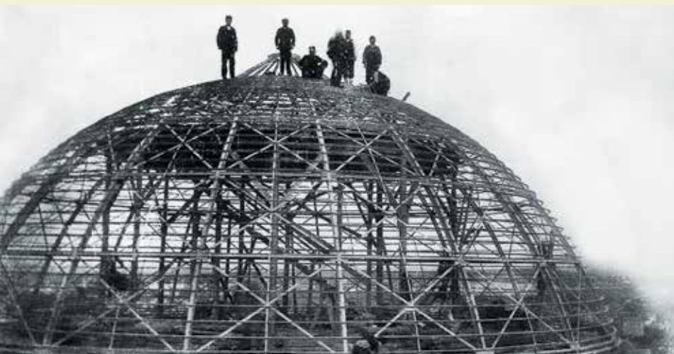
Металлическая конструкция главного купола