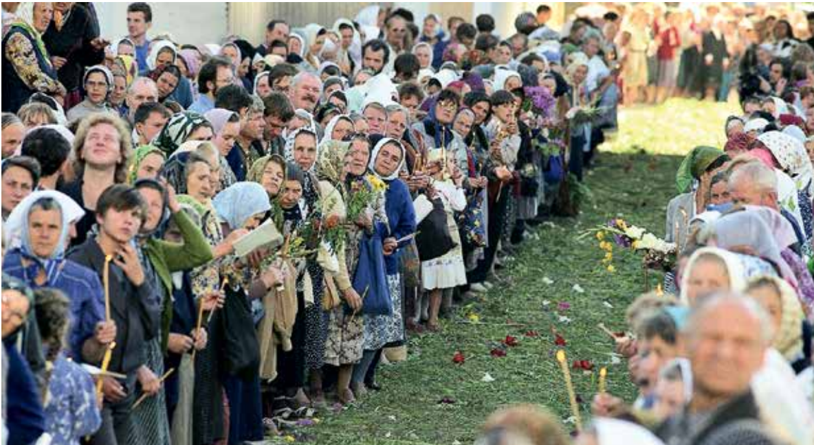
Серафимо-Дивеевский монастырь готовится к встрече мощей