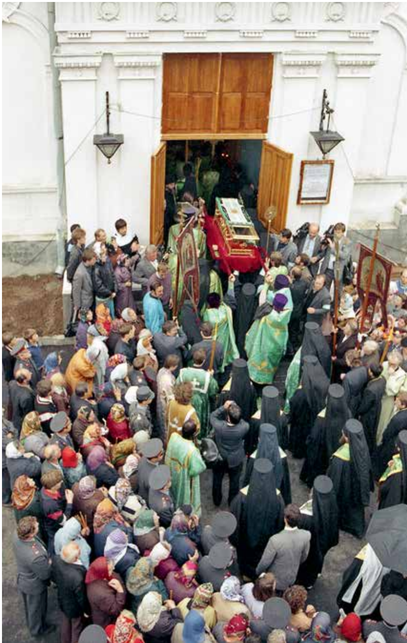
Ковчег с мощами преподобного Серафима Саровского вносят в Спаский Староярмарочный собор Нижнего Новгорода