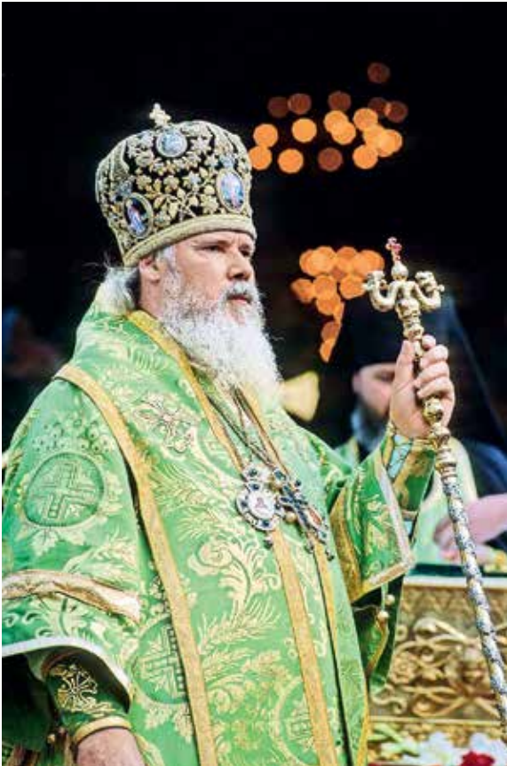
Патриарх Алексей II во время Литургии в Серафимо- Дивеевском монастыре