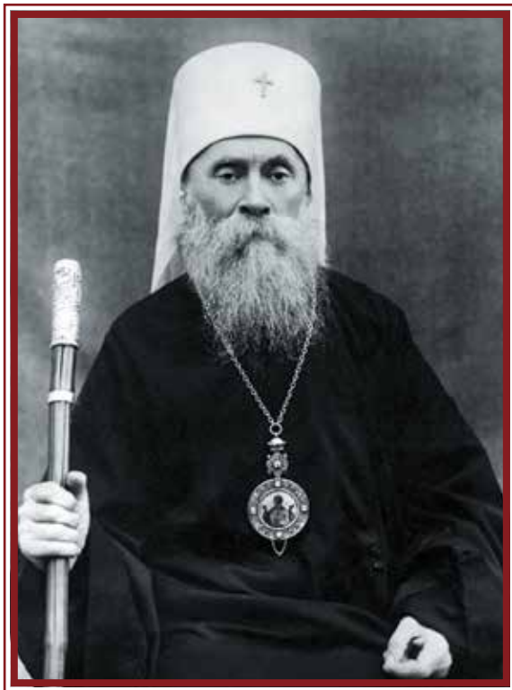
Архиепископ Гавриил (Чепур)