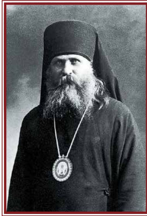
Епископ Вениамин (Федченков)

де в другие Поместные Церкви — слишком непонятным и чуждым казался их церковный быт.