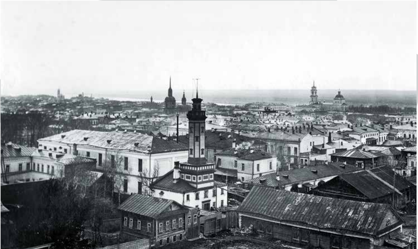
Вид на центральную часть г. Перми до 1917 г.

методом психологического устрашения представителей советской власти. Крестные ходы состоялись в Москве, Нижнем Новгороде, Перми, Воронеже и других городах. Не везде удалось сохранить мирный характер церковных шествий. В Харькове, Нижнем Новгороде, Владимире, Саратове, Туле, Воронеже, Шацке, Вятке устроенные без разрешения местных властей крестные ходы привели к столкновениям и кровопролитию 4 . Всего, по данным официальных советских источников, с января по май 1918 года «в волнениях на религиозной почве» погибло 687 человек 5 .