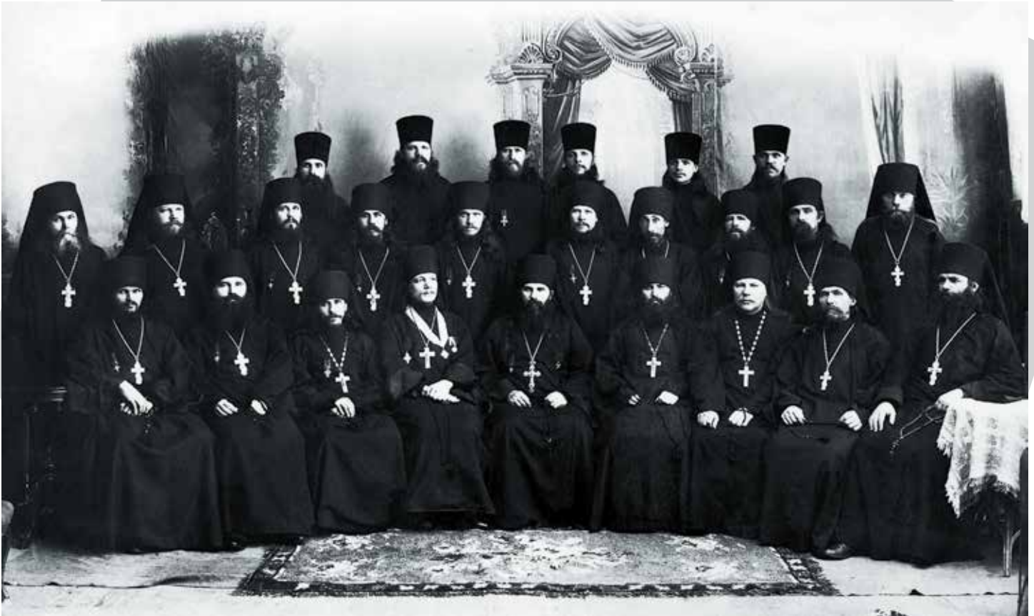
Монашеская братия Белогорского монастыря. 1915 г.

ва владеть собственностью. Прав юридического лица они не имеют». Статья 13: «Все имущества существующих в России церковных и религиозных обществ объявляются народным достоянием» 7 . Таким образом, советская власть на законодательном уровне лишала Церковь права иметь какую-либо собственность и самостоятельно распоряжаться своим прежним имуществом.