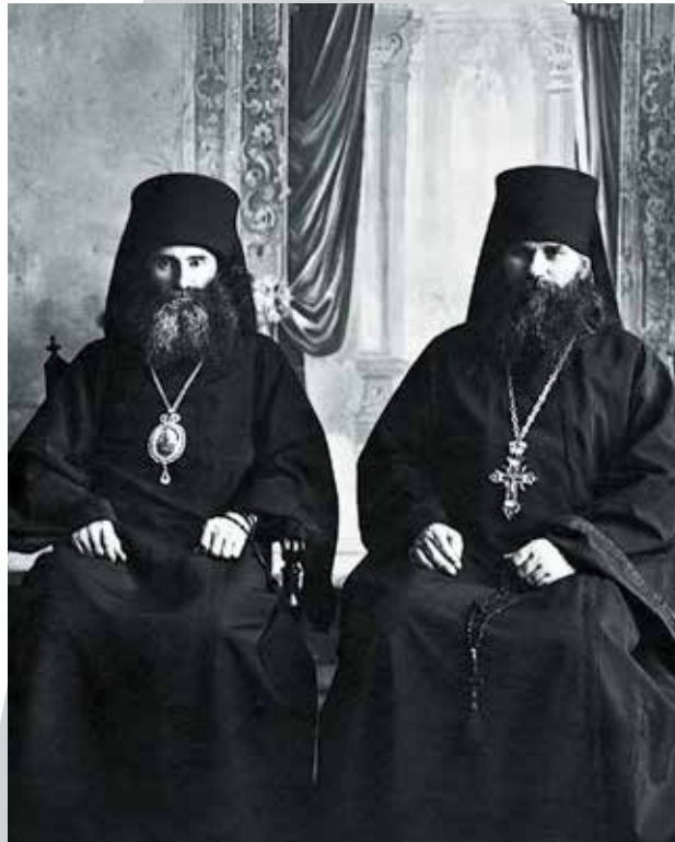
Священномученик епископ Пермский и Кунгурский Андроник (Никольский) и настоятель Белогорского монастыря сщмч. архим. Варлаам (Коноплев). 1916 г.

Характерно, что именно крестные ходы в то время стали наиболее распространенной, безупречной с религиозно-нравственной точки зрения, формой выражения протеста и сопротивления церковного народа действиям богоборцев. Сопровождаемые колокольным звоном городских и сельских храмов, крестные ходы представляли собой вполне традиционные массовые мероприятия церковно-литургического характера. Однако в условиях разворачивавшихся гонений они приобретали иной смысл, становясь акцией солидарности верующих и одновременно