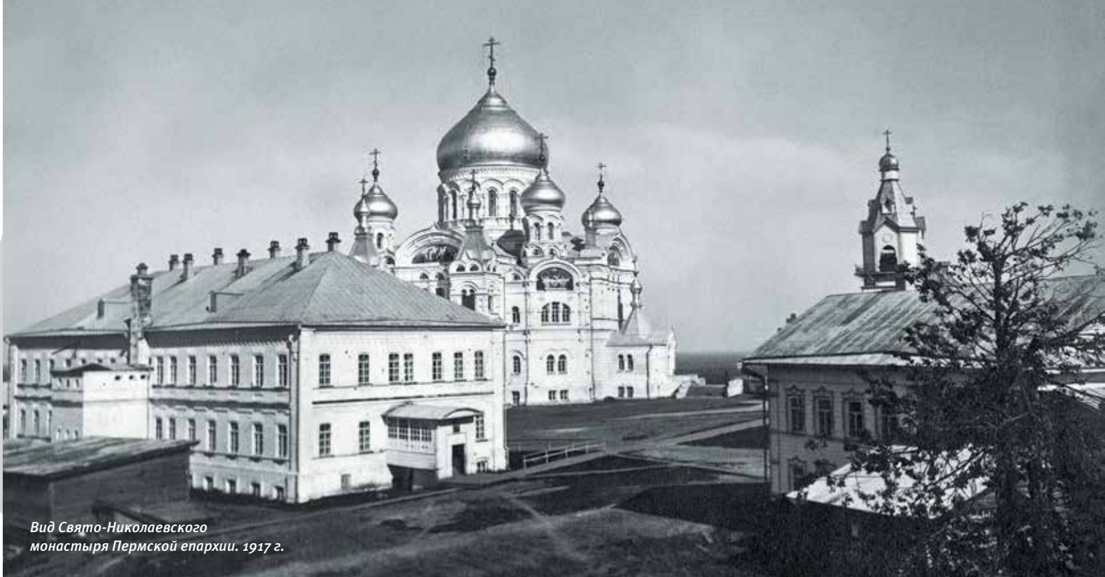
Вид Свято-Николаевского монастыря Пермской епархии. 1917 г.