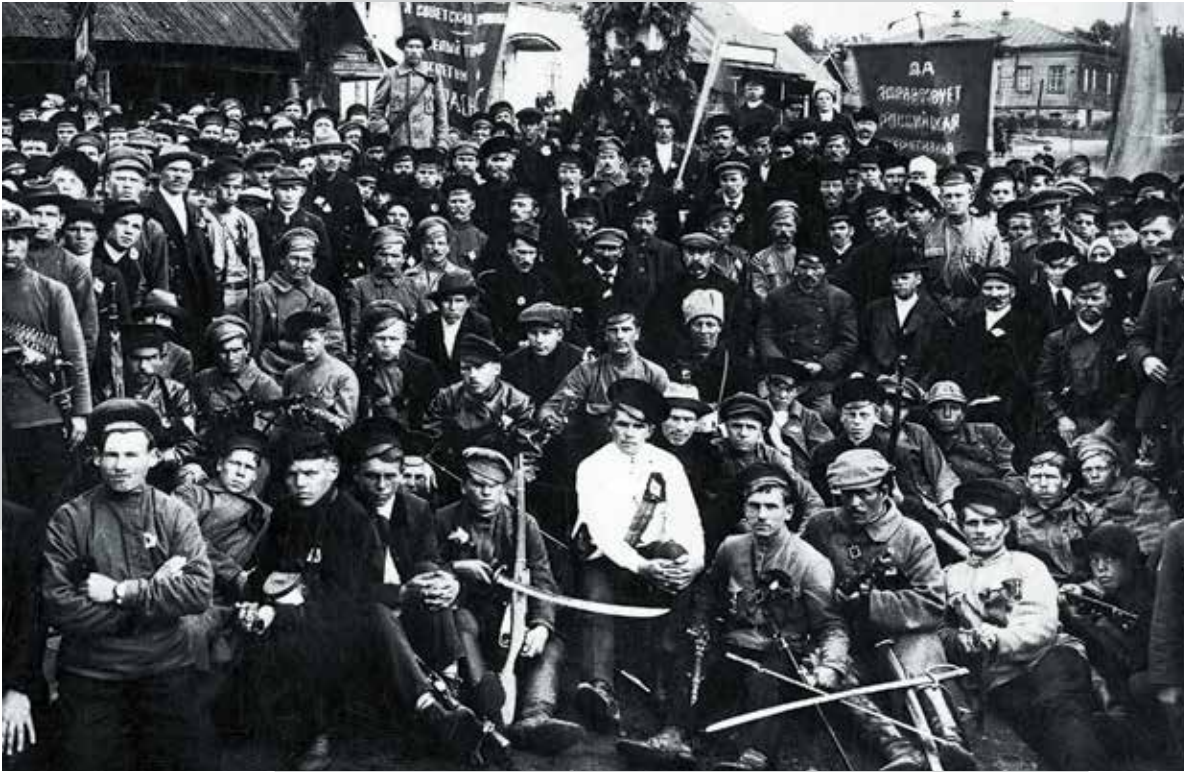
Красногвардейцы- заводчане 1918 г.

рода. Именно они, научившись на войне владеть огнестрельным оружием, могли открыть огонь по красногвардейцам, воспользовавшись захваченными у них же винтовками и пистолетами. Арестованные были немедленно доставлены в исполнительный комитет для дачи показаний.