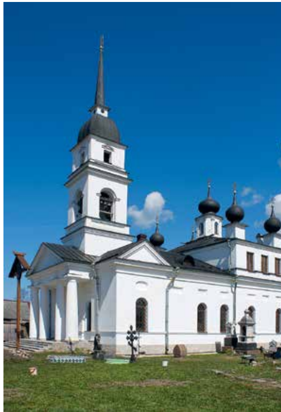
Храм свт. Николая Мирликийского, Ленинградская обл., Кировский р-н, дер. Кобона

С осени 1941 г. связь Ленинграда с Большой землей осуществлялась по Ладожскому озеру: в весенне-летней период — кораблями Ладожской флотилии, зимой — по знаменитой ледовой автодороге ВАД-101, получившей название «Дорога жизни».