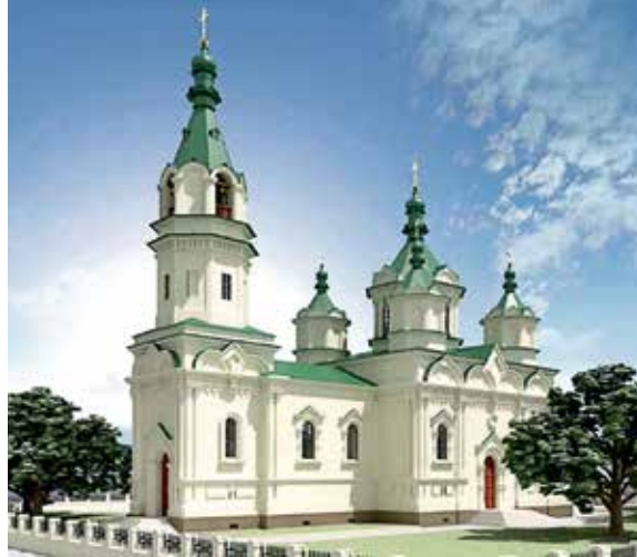
Храм свт. Модеста, Патриарха Иерусалимского. Ленинградская обл., Волховский р-н, дер. Иссад (слева вверху)